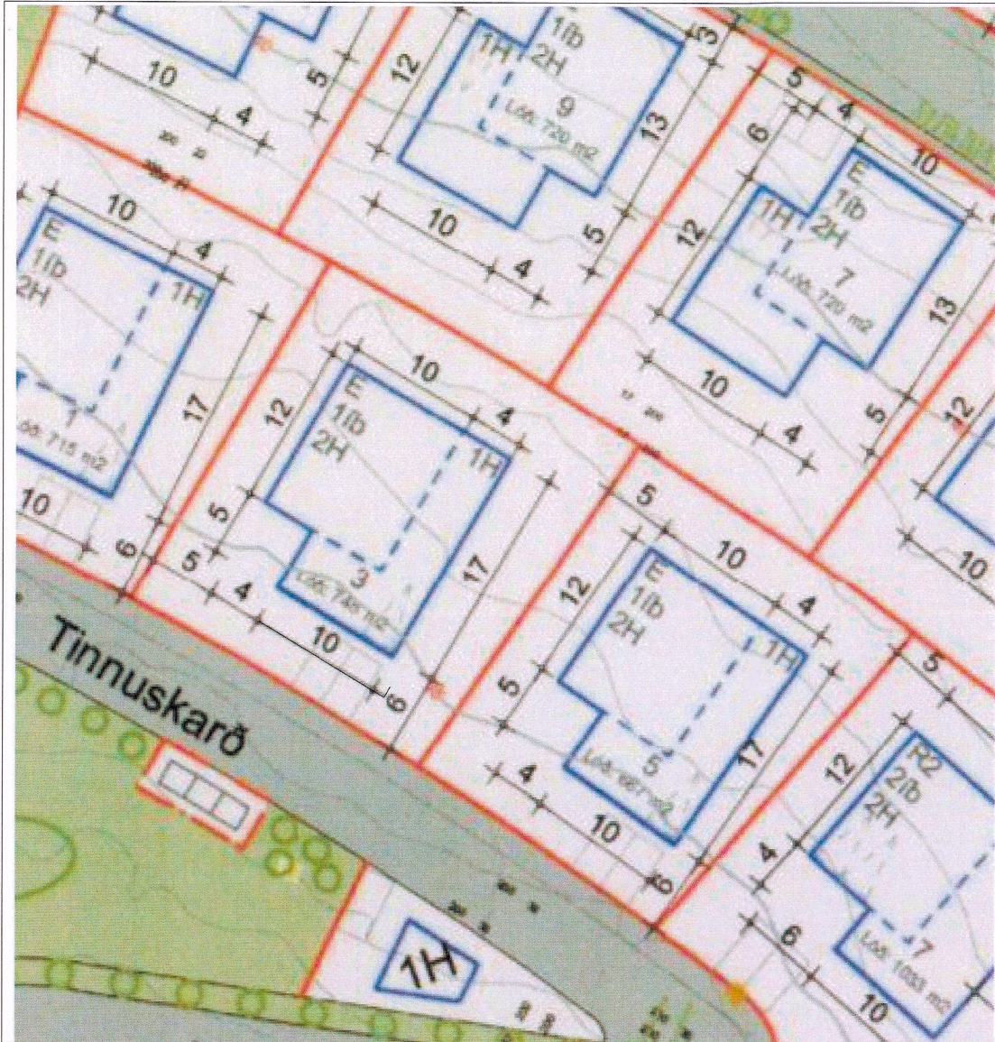
FYRIR BREYTINGU - Í GILDI FRÁ 03.04.2018