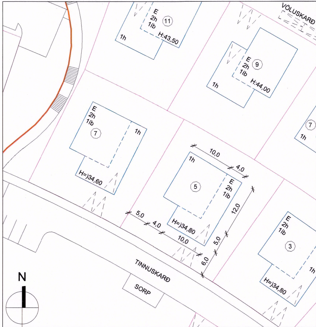
FYRIR BREYTINGU - Í GILDI FRÁ 30.08.2018