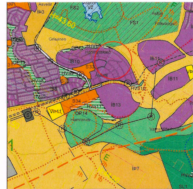
YFIRLIT - HLUTI AÐALSKIPULAGS HAFNARFJ. 2013 - 2025

Í breytingunni felst að byggingarreitur er stækkaður og honum er speglað. Með breytingunni snýr þakgarður í suð vestur í stað suð austur. Byggingarmagn helst óbreytt ásamt öðrum skilmálum í deiliskipulagi.