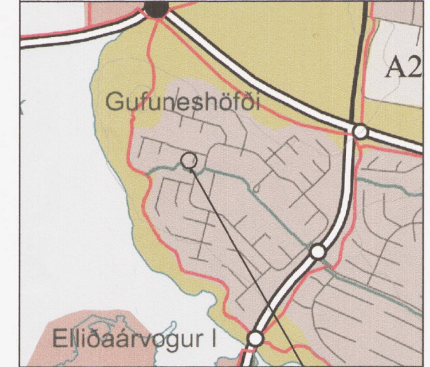
Gildandi Aðalskipulag Reykjavíkur - Staðsetning lóðar Hamrahverfi