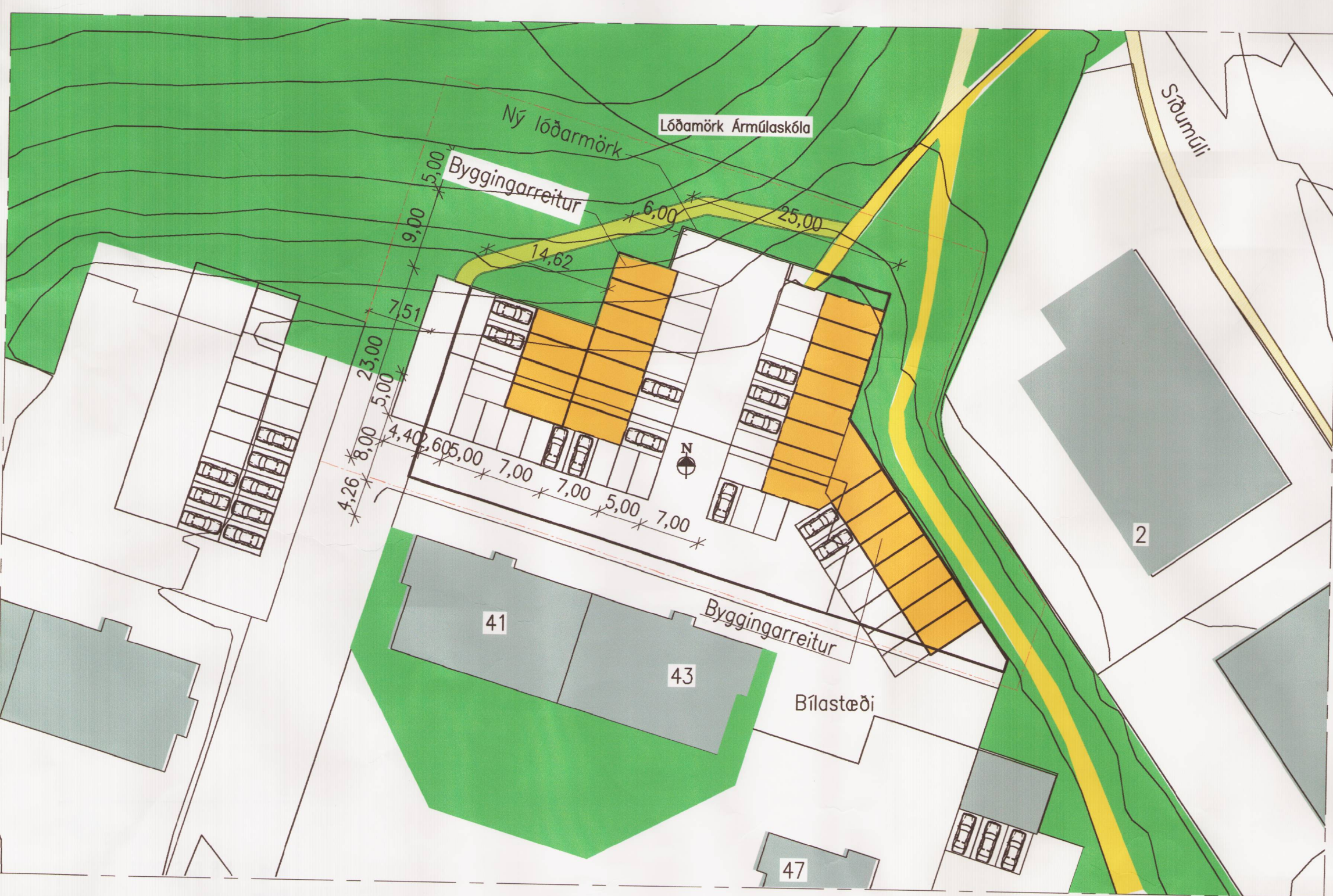
BREYTT DEILISKIPULAG, 1:500

Deiliskipulagsbreyting þessi var í kynningu frá 18/2 2002 - til 19/3 2002