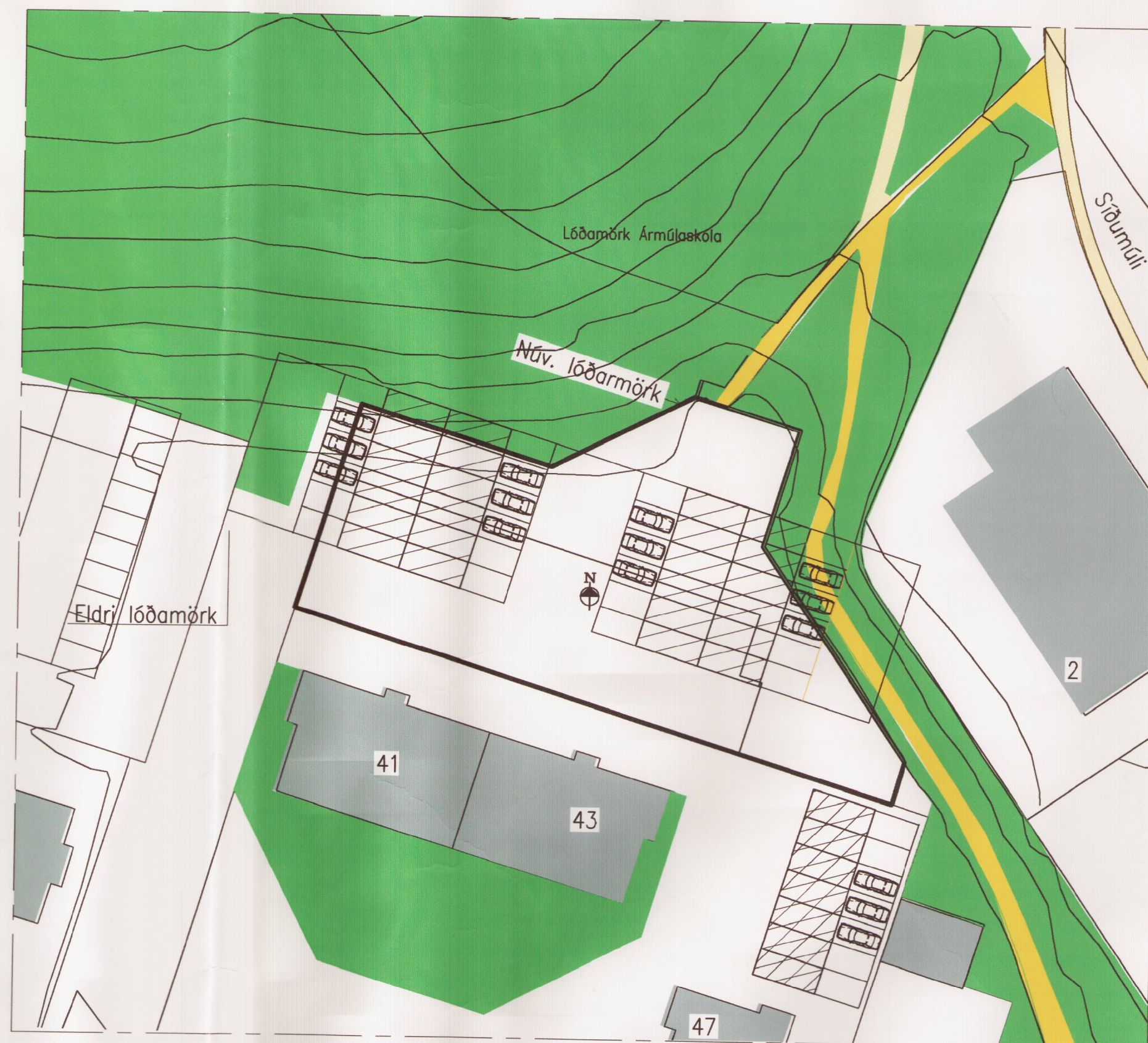
NÚVERANDI SKIPULAG, 1:500