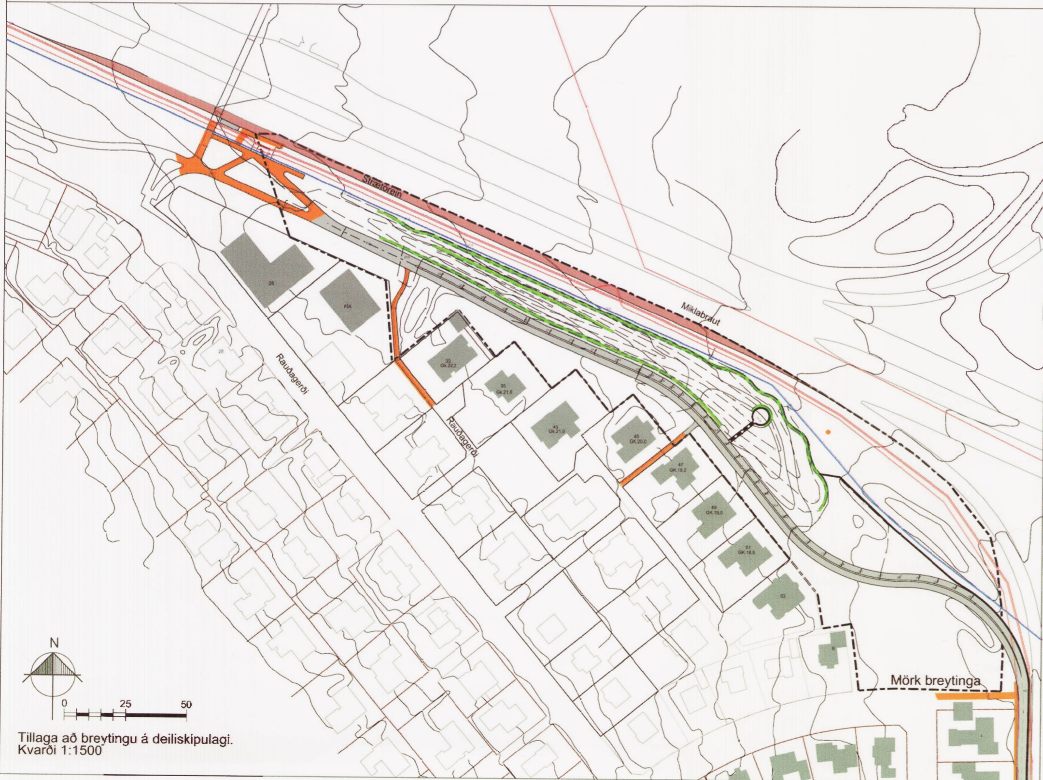
Tillaga að breytingu á deiliskipulagi. Kvarði 1:1500