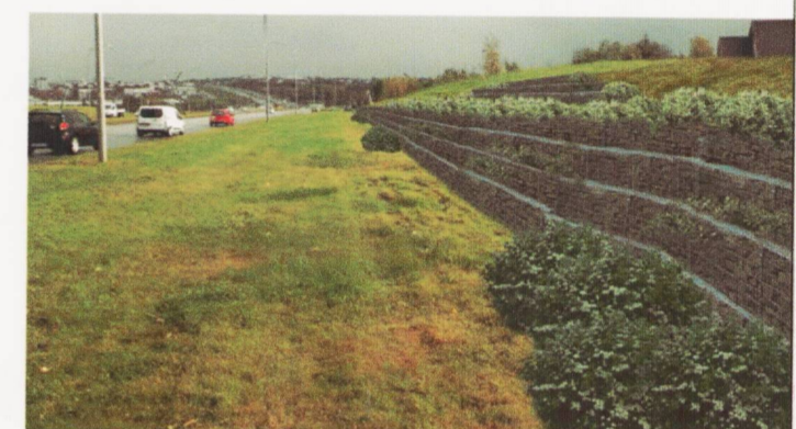
Ásýnd, gabions meðfram Miklubraut