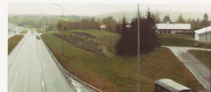
Ásýnd, séð ofan af göngubru sem liggur yfir Miklubraut