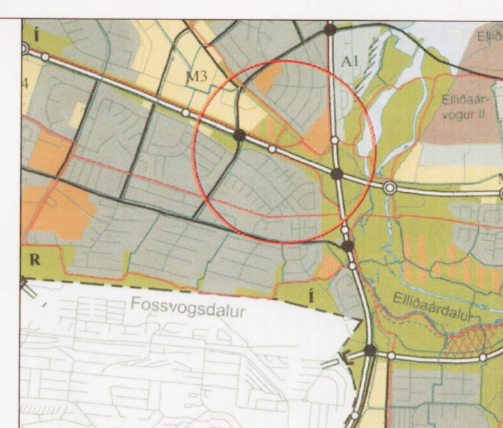
Aðalskipulag Reykjavíkur 2001 - 2024. (Hluti)