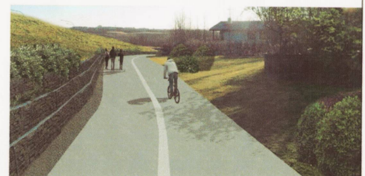
Ásýnd, gabions meðfram göngustig sem liggur við Rauðagerði