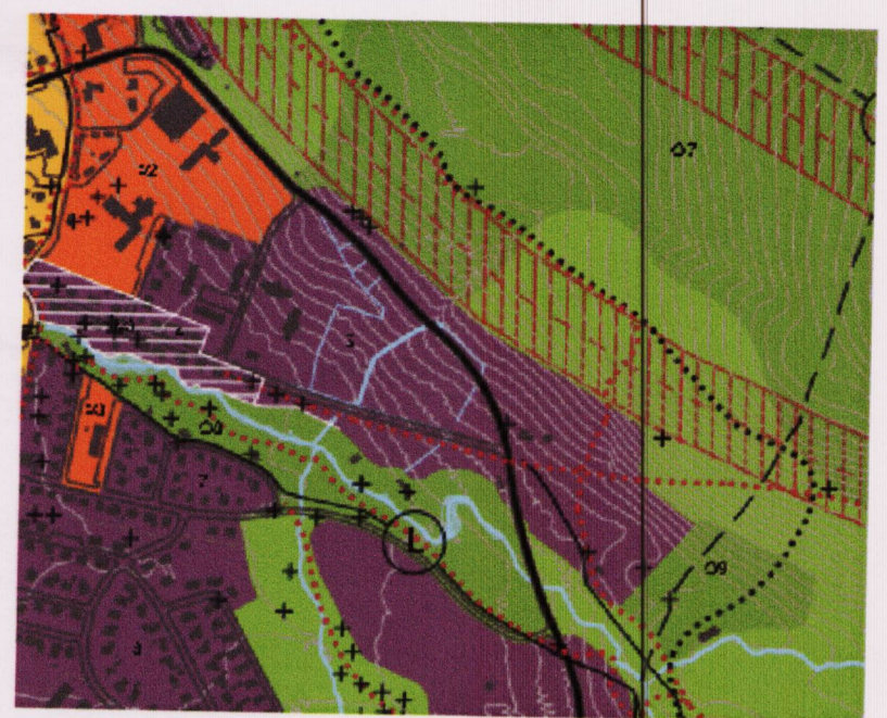
ÚR AÐALSKIPULAGI NORÐURÞINGS 2010-2025