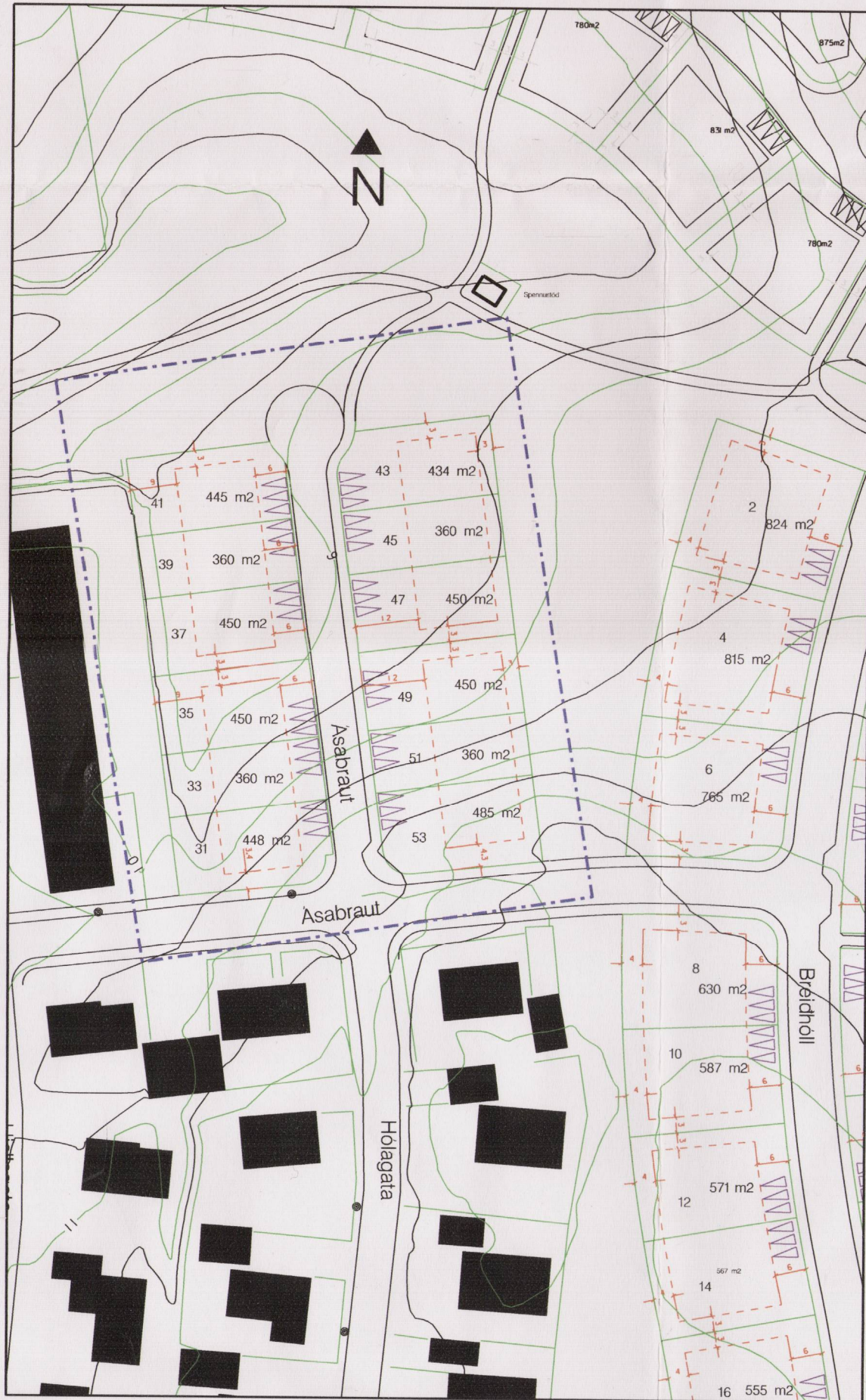
Gildandi deiliskipulag samþykkt í sveitastjórn 2. 11. 2005.