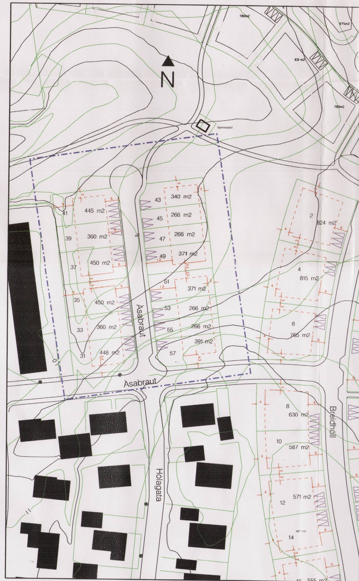
Tillaga að deiliskipulagsbreytingu dags. 01.05.2017