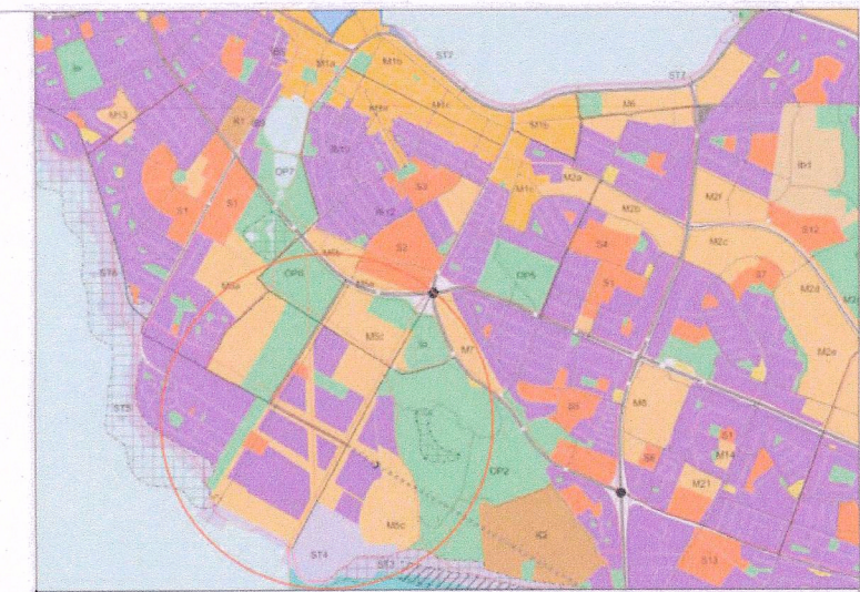
Aðalskipulag Reykjavíkur 2010-2030

Deiliskipulagsbreyting þessi sem fengið hefur meðferð í samræmi við ákvæði 1. mgr. 43. gr. skipulagslaga nr. 123/2010 var samþykkt í skipulags- og samg.ráði þann 3. júní, 2020 og í borgarráði þann 16. júní, 2020.