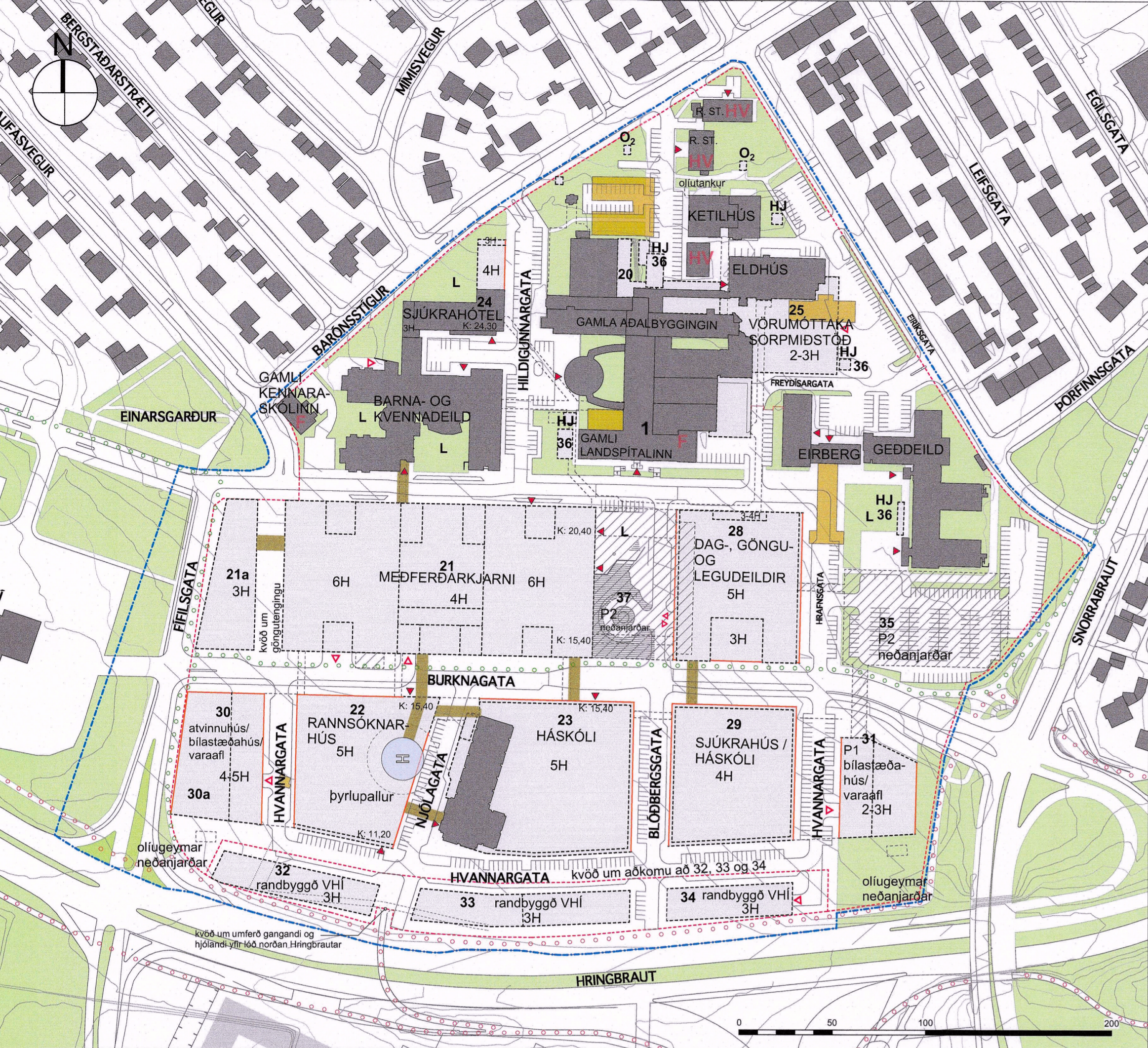
GILDANDI DEILISKIPULAG, mkv. 1:2000

Samþykkt í borgarráði 21. mars 2013, síðast breytt september 2019 Auglýst B deild Stjórnartíðnda 1. mars 2019