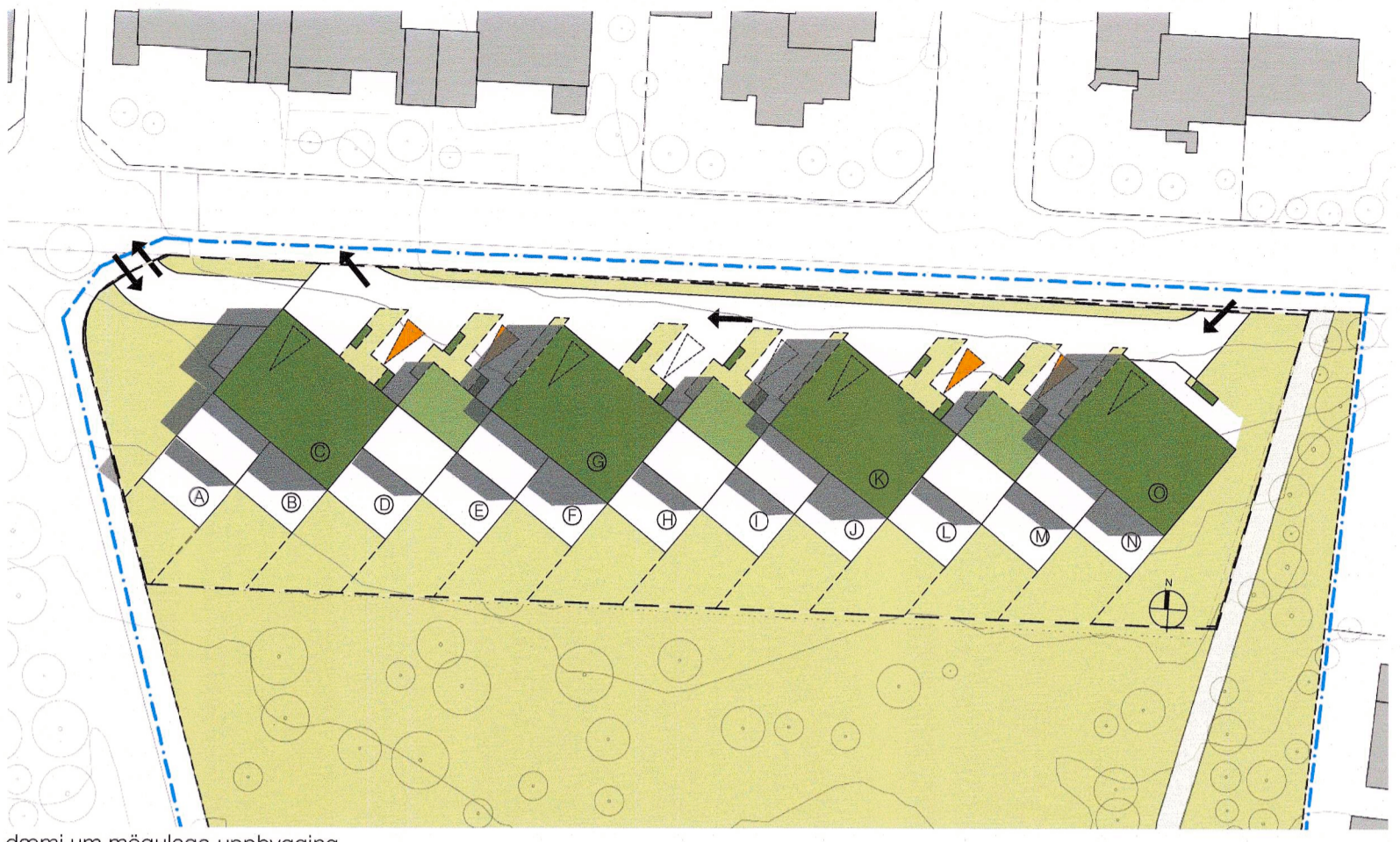
dæmi um mögulega uppbygging