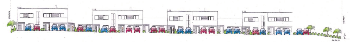
götumynd, samþykkt útlitsmynd fyrir breytingu