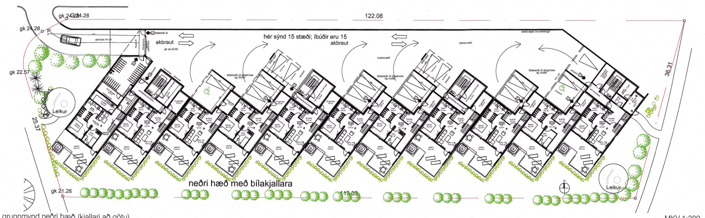
grunnmynd neðri hæð (kjallari að götu)