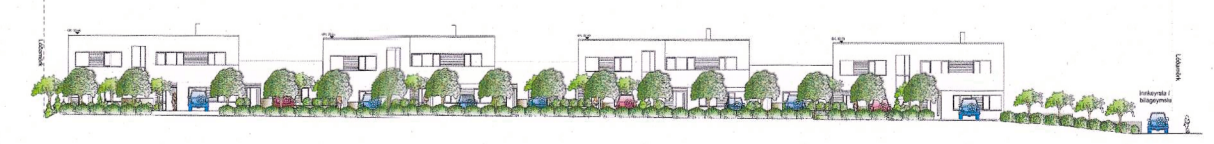
götumynd, samþykkt útlitsmynd eftir breytingu bílastæða með grænni ásýnd.