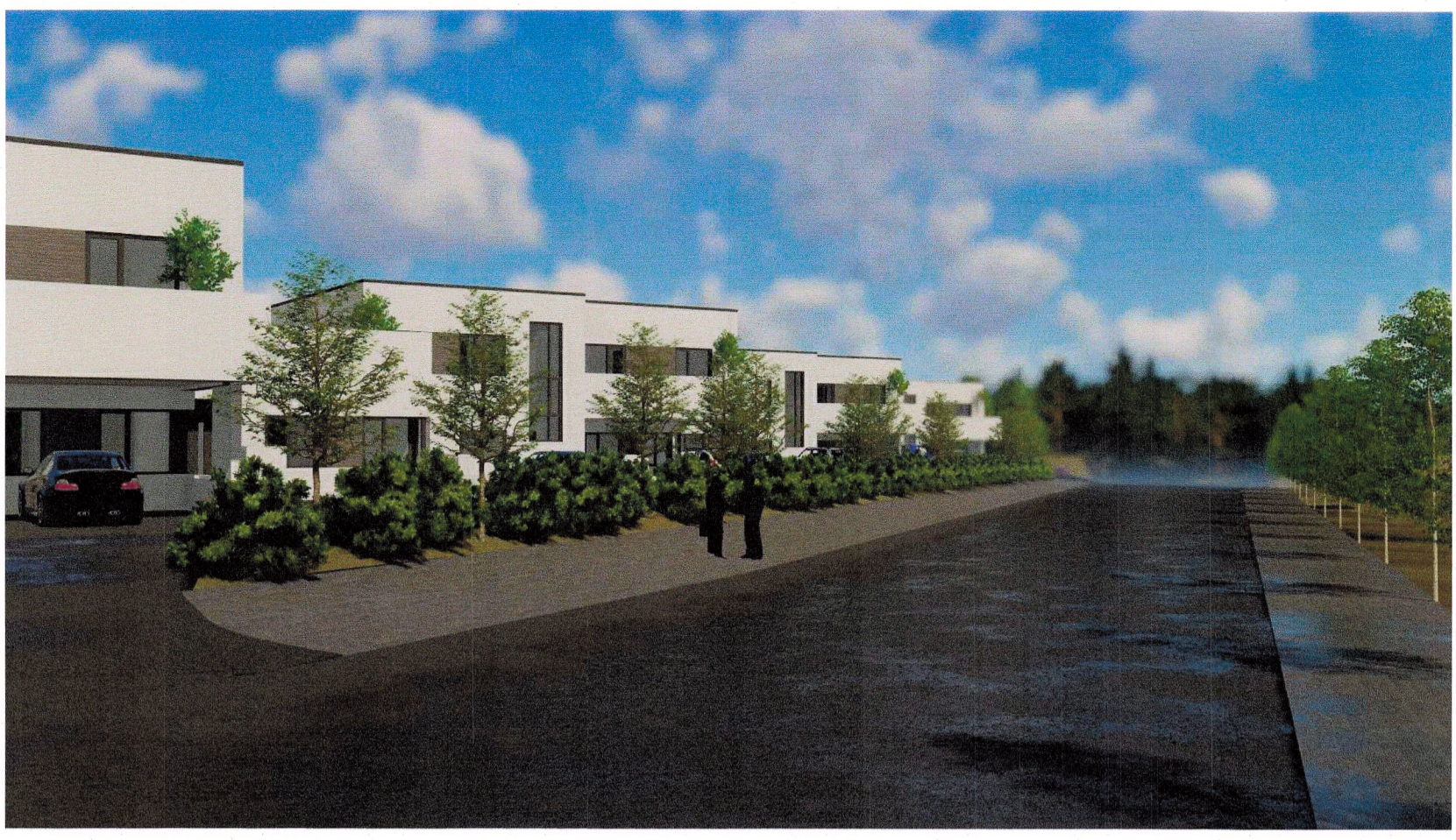
uppbygging við Fossvoogsveg