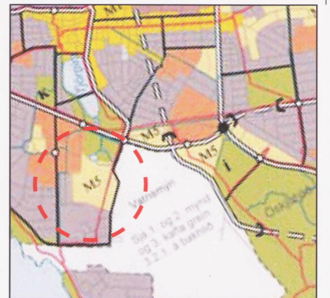
Aðalskipulag Reykjavíkur 2001-2024

til hönnunar þeirra ma. skal gera ráð fyrir gróðurreitum sem gefa bilastæðum grænt yfirbragð. Starfsemi: Heimilt er að starfrækja á lóðinni fyrirtæki og stofnanir á sviði rannsóknna, vísinda og þekkingar sem hafa hag af staðsetningu á háskólasvæðinu, leggja háskólastarfermissni líð með nálægð sinni eða tengjast henni. Á lóðinni er og heimilt að vera með verslunar og þjónustustarfsemi í smáum stíl til að þjónusta fyrirtæki og stofnanir á svæðinu, svo sem litlar verslanir, kaffihús, líkamsrækt, ljósurtnarþjónusta o.fl. Annað: Kvaðir um lagnir o.fl. verða sýndar á mæliblaði. Hús á svæðinu og bilastæði skulu grunduð á hraunpúða til þess að breyta ekki grunnvatnsstöðu svæðisins. Lækkun grunnvatns með löngu er óheimil. Vatni af bilastæðum og þökum skal veitt í grunnvatn skv. nánari fyrirætlun borgarverksvæðis. Áður en hafist verður handa við byggingu á svæðinu skal gerð jarðvegskönnun og könnuð áhrif framkvæmda á stöðu grunnvatns. Eignarhald bygginga á lóðinni skal vera á einni hendi [Deiliskipulaginu fylgir skýringauppdráttur dags. 23.11.2001]