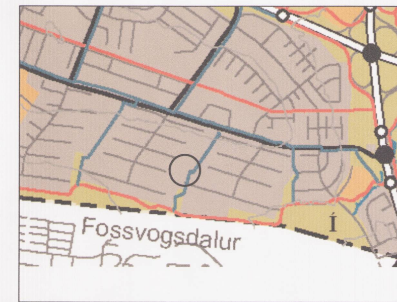
HLUTI AÐALSKIPULAGS REYKJAVÍKUR 2001-2024