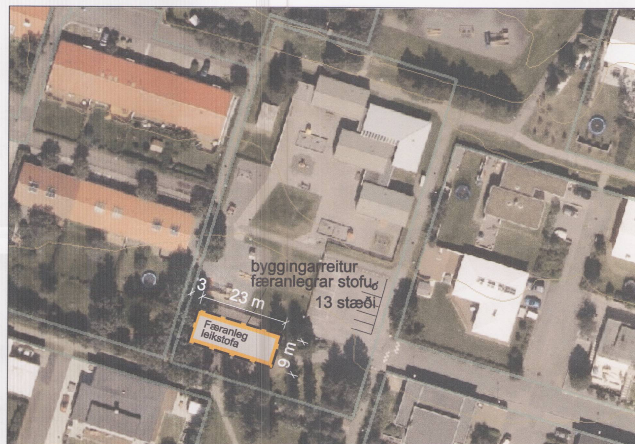
Skýringarmynd: Loftmynd mkv. 1:1000

Að öðru leyti gilda eldri skilmálar óbreyttir. Eldri kvaðir á svæðinu er óbreyttar.