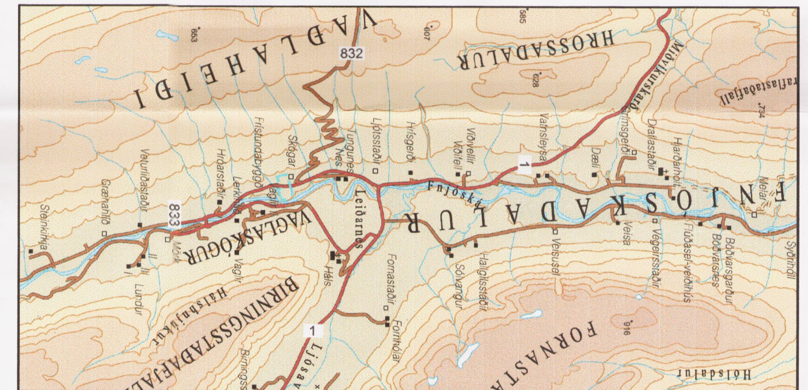
Yfirlitskort - mkv. 1:100 000

Deiliskipulag þetta sem fengið hefur meðferð skv. 25. gr. skipulags- og byggingarlaga nr. 73/1997 með síðari br. var samþykkt í sveitarstjórn Þingeyjarsveitar þann 14. mars 2011 [Signature] Sveitarstjórn Þingeyjarsveitar