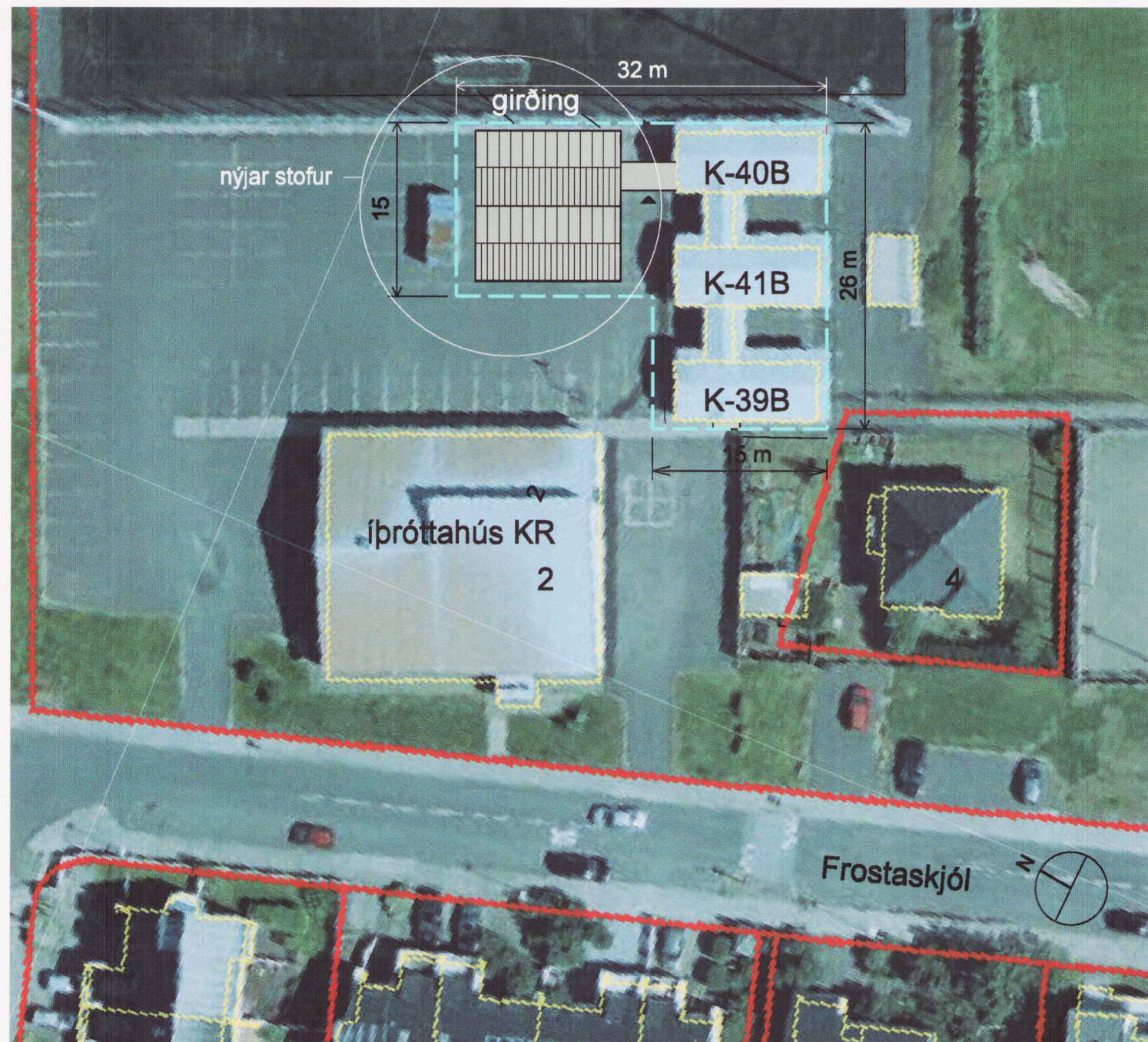
Skýringarmynd: loftmynd af núverandi færanlegum stofum og fyrirhugaðri staðsetningu á viðbótarstofum mkv.1:500