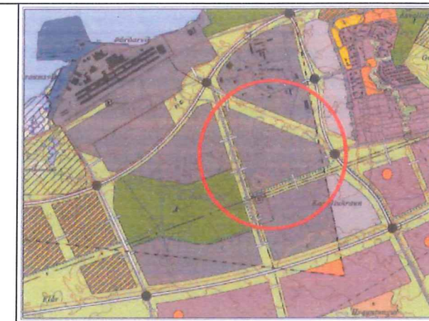
Yfirlit - Hluti aðalskipulags Hafnarfjarðar 2013-2025