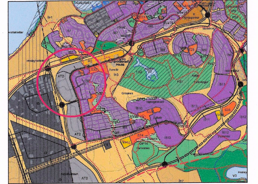
HLUTI AF DEILISKIPULAGI HAFNARFJÖRÐUR 2013-2025.