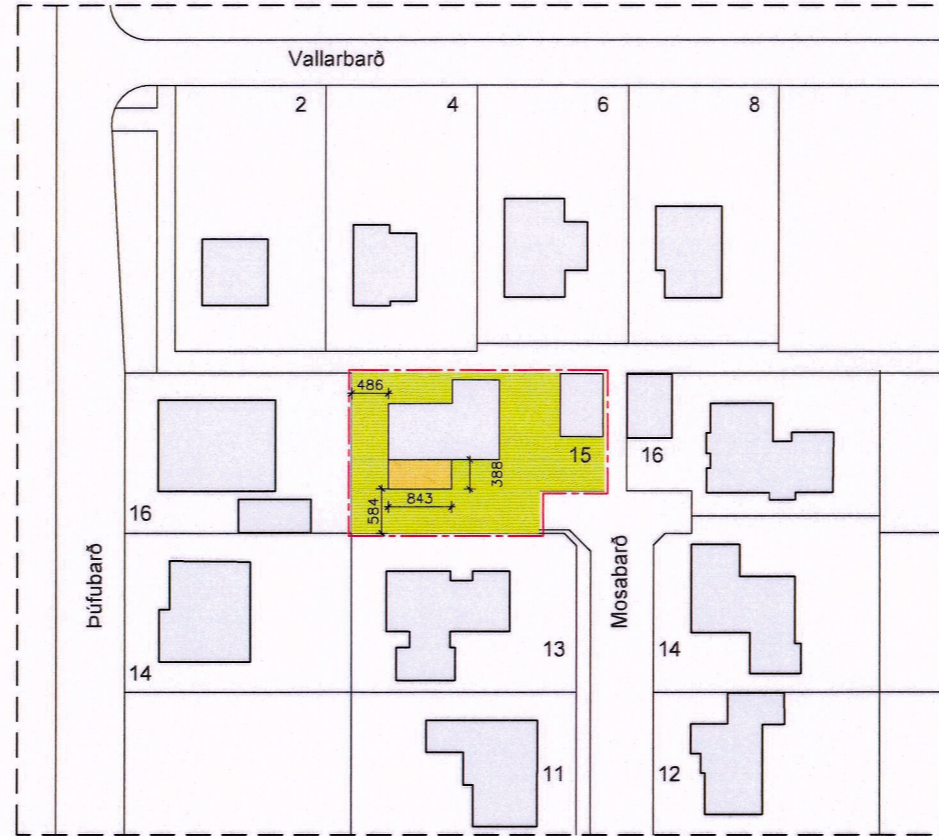
Mosabarð 15 Breytt deiliskipulag. Mkv: 1:1000

Greinargerð: Mosabarð 15 er hluti af samþykktu deiliskipulagi ásamt greinargerð skipulagsins Hvaleyrarholt suð-austur.