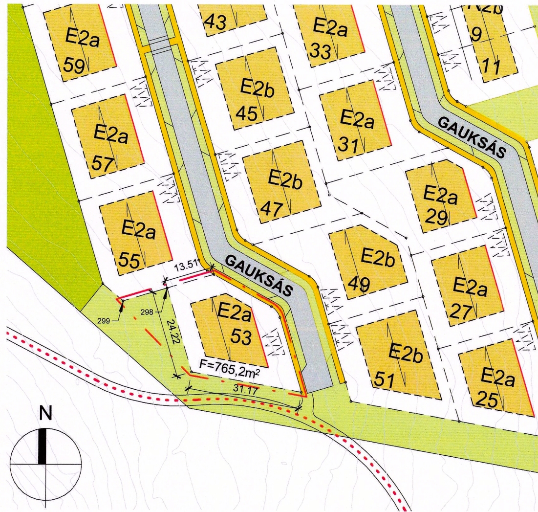
Gauksás 53 - Gildandi deiliskipulag