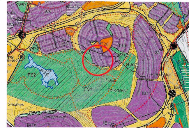
YFIRLIT - Hluti aðalskipulags Hafnarfjarðar 2013 - 2025

Komi til færslu á götugögnum eða lögnum verði það á kostnað lóðarhafa.