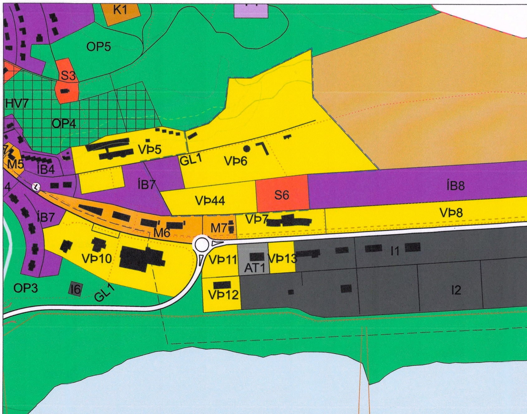
Breyting á aðalskipulagi, þéttbýlisuppdráttur í apríl 2024. Mkv. 1: 5000