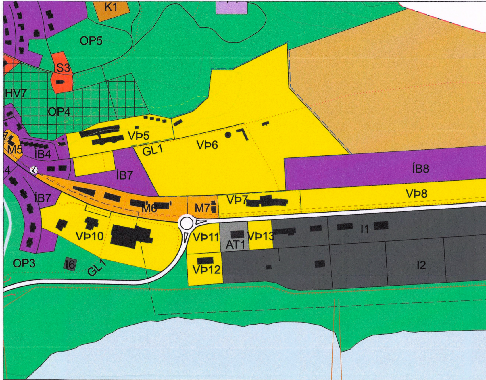
Gildandi aðalskipulag Mýrdalshrepps 2021-2033, samþykkt. 05.07.2023. Mkv. 1:5000