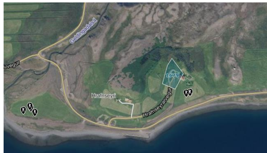
Mynd 2.2 Friðlýstar fornminjar á Hrafnseyri, merkt R. Svæði þar sem fornleifaskráning hefur verið unnið er skyggt. 3

og jökulminjar. Hrafnseyri er fjölsóttur ferðamannastaður með söguminjum.” 2