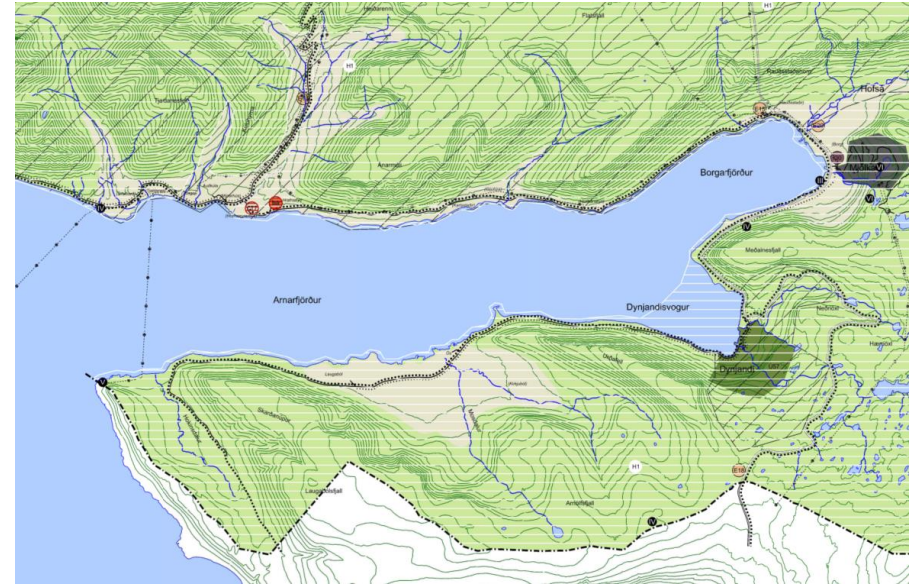
Mynd 2.1 Gildandi aðalskipulag, hluti sveitarfélagsuppdráttar – sunnan Djúps.

Vísað er til nánari framkvæmdalýsingar í kafla 3 í tilkynningarskýrslu framkvæmdarinnar í viðauka I, þ.e. Tilkynning til ákvörðunar um matsskyldu. Lagning 66 kv jarðstrengs milli Mjólkár og Bíldudals og sæstrengs yfir Arnarfjörð . Lega strengsins hefur þó breyst frá tilkynningunni, þ.e. landtaka verður staðsett á Hrafnseyri en ekki í Auðkúlubót.