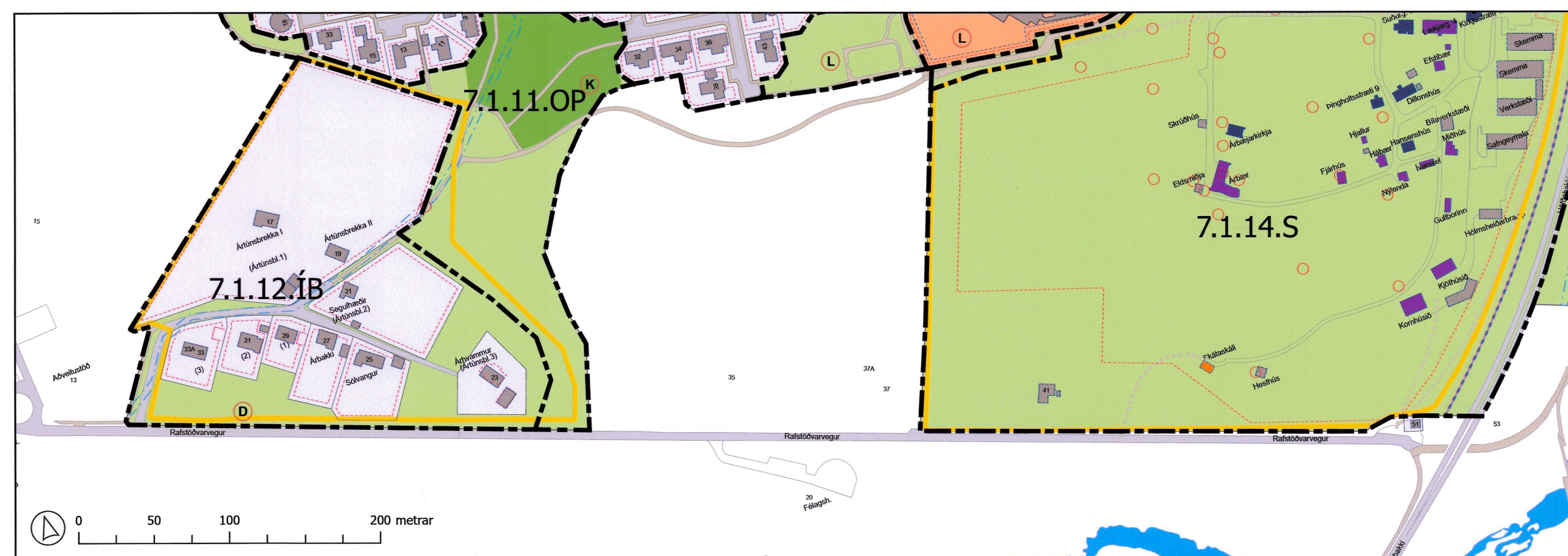
Yfirlitsuppráttur hverfisSKIPULAGS 1:3000, eftir breytingu.