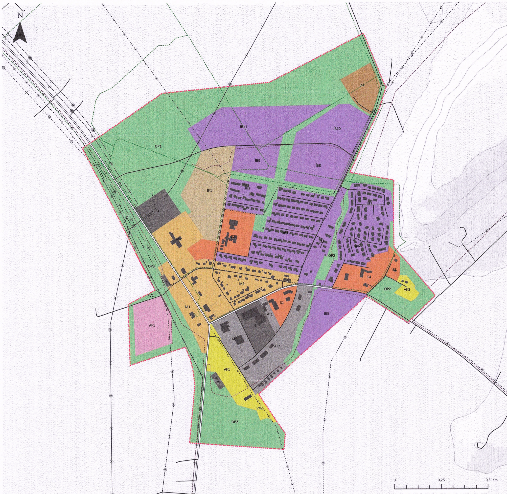
Þéttbýlisuppráttur Hvolsvöllur 1:10.000