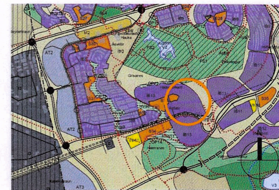
Yfirlit - Hluti Aðalskipulags Hafnarfj. 2013-2025

Að öðru leyti gilda skilmálar gildandi deiliskipulags.