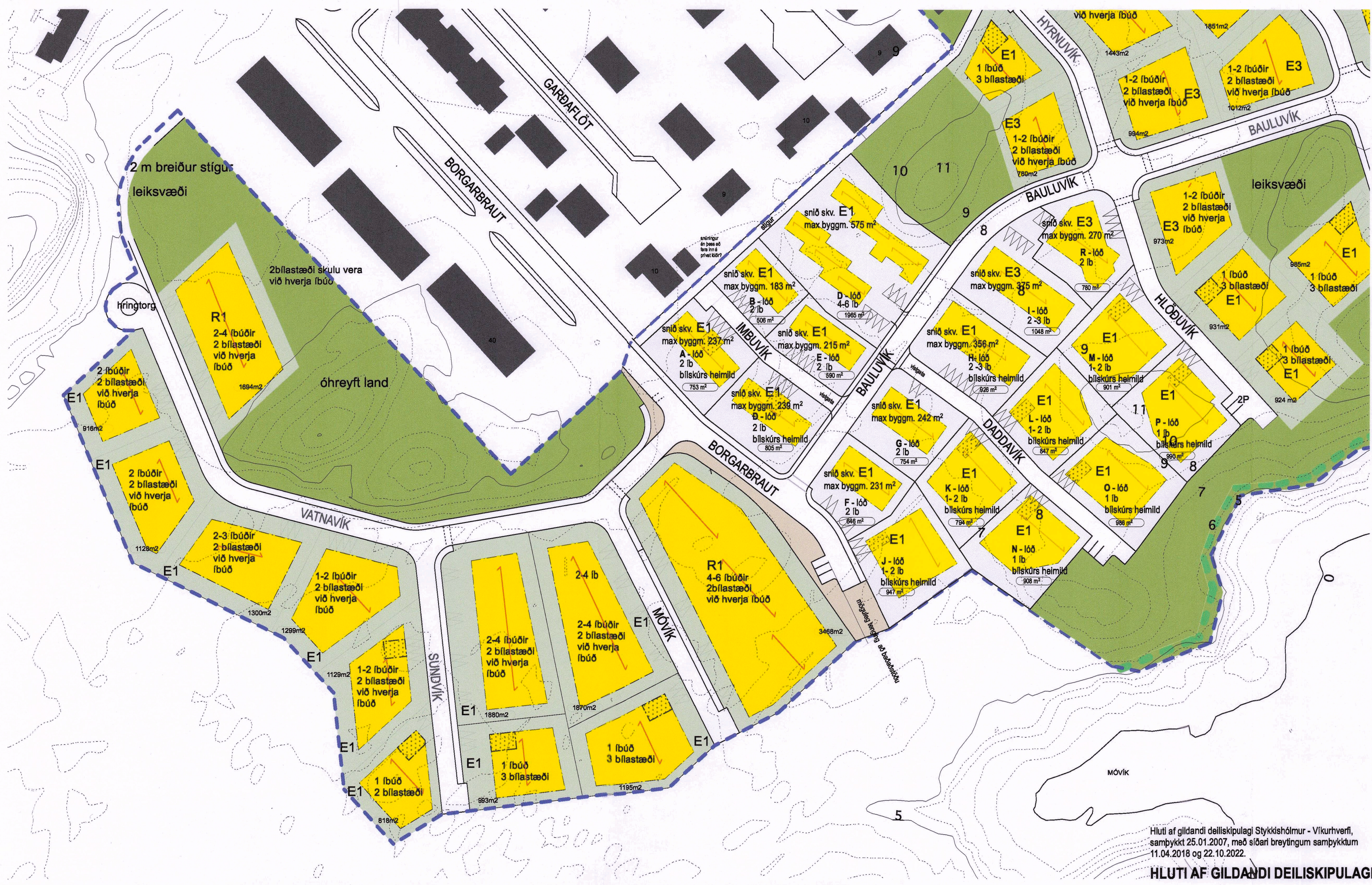
Húli af gildandi deiliskipulagi Stykkishólms - Víkurhverfi, samþykkt 25.01.2007, með úbæri breytingum samþykktum 11.04.2018 og 22.10.2022. HLUTI AF GILDANDI DEILISKIPULAGI