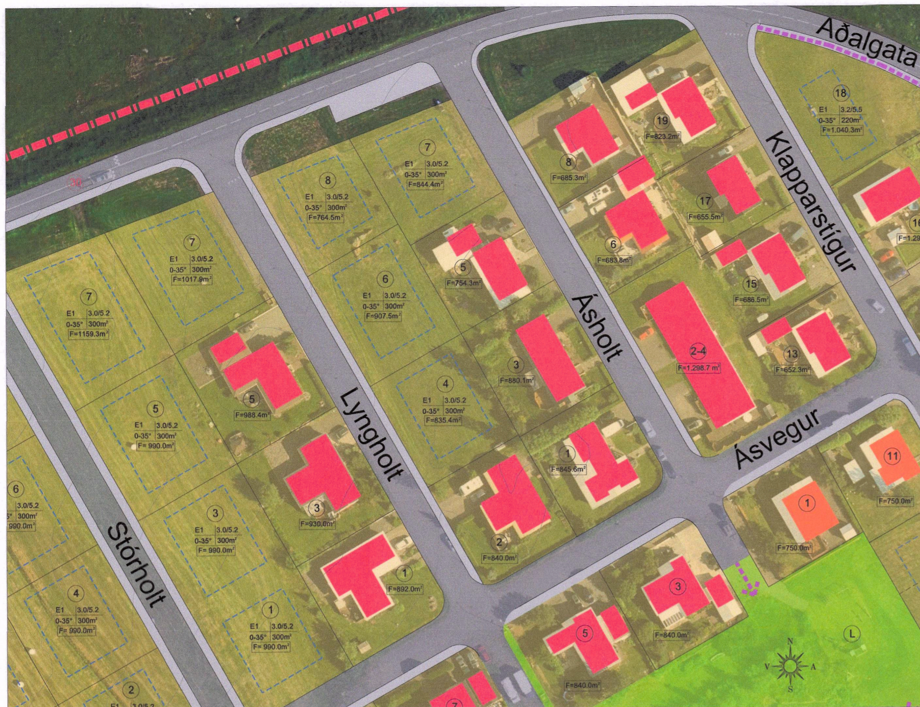
Gildandi deiliskipulag tók gildi 28. nóvember 2022 með síðari breytingum - mkv. 1:1000