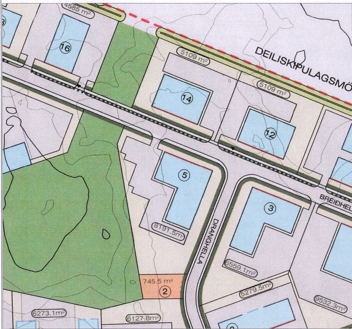
FYRIR BREYTINGU, deiliskipulag Hellnabraun 2. áfangi, staðfest 11.04.2011