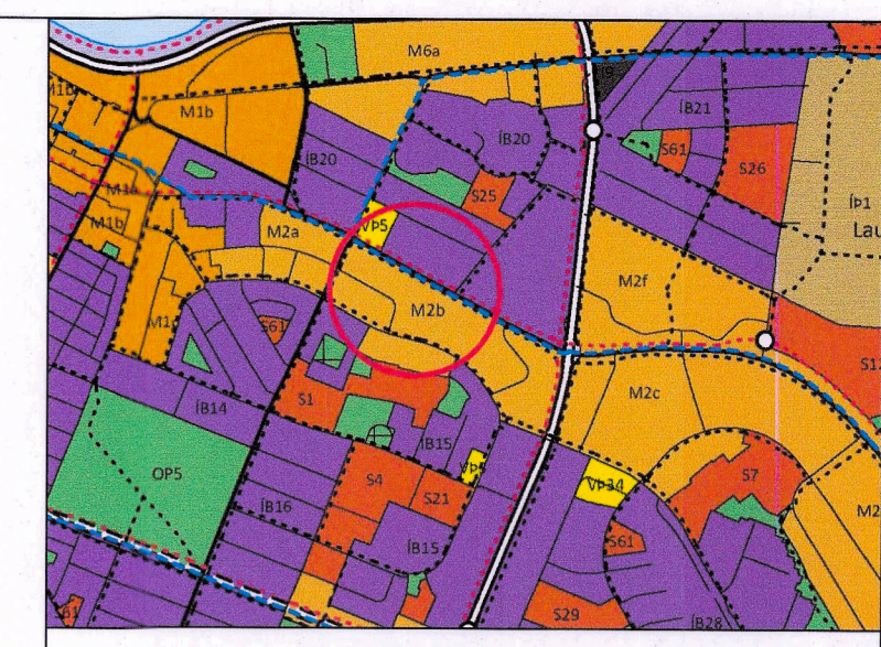
Hluti Aðalskipulags Reykjavíkur 2040