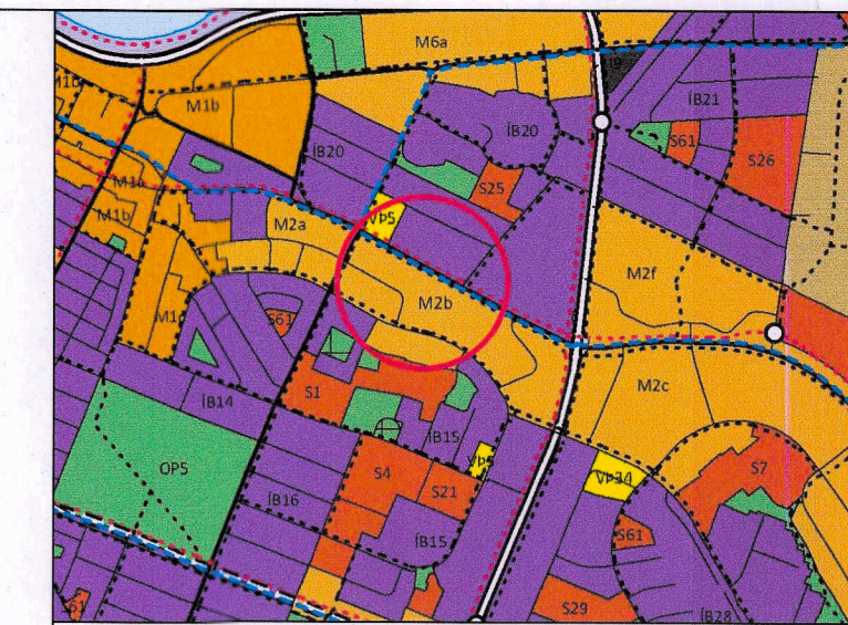
Hluti Aðalskipulags Reykjavíkur 2040