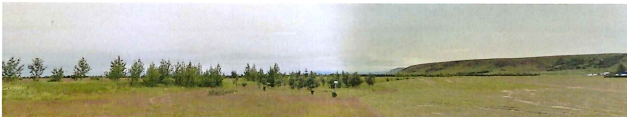
MYND 1. Horft yfir skipulagssvæðið - Að hluta til opið svæði.

Í dag er skipulagssvæðið óbyggt svæði og var áður nýtt sem tún. Landið er flatt að mestu og fremur opið en nokkrar manir eru á svæðinu eins og sést á mynd 1.