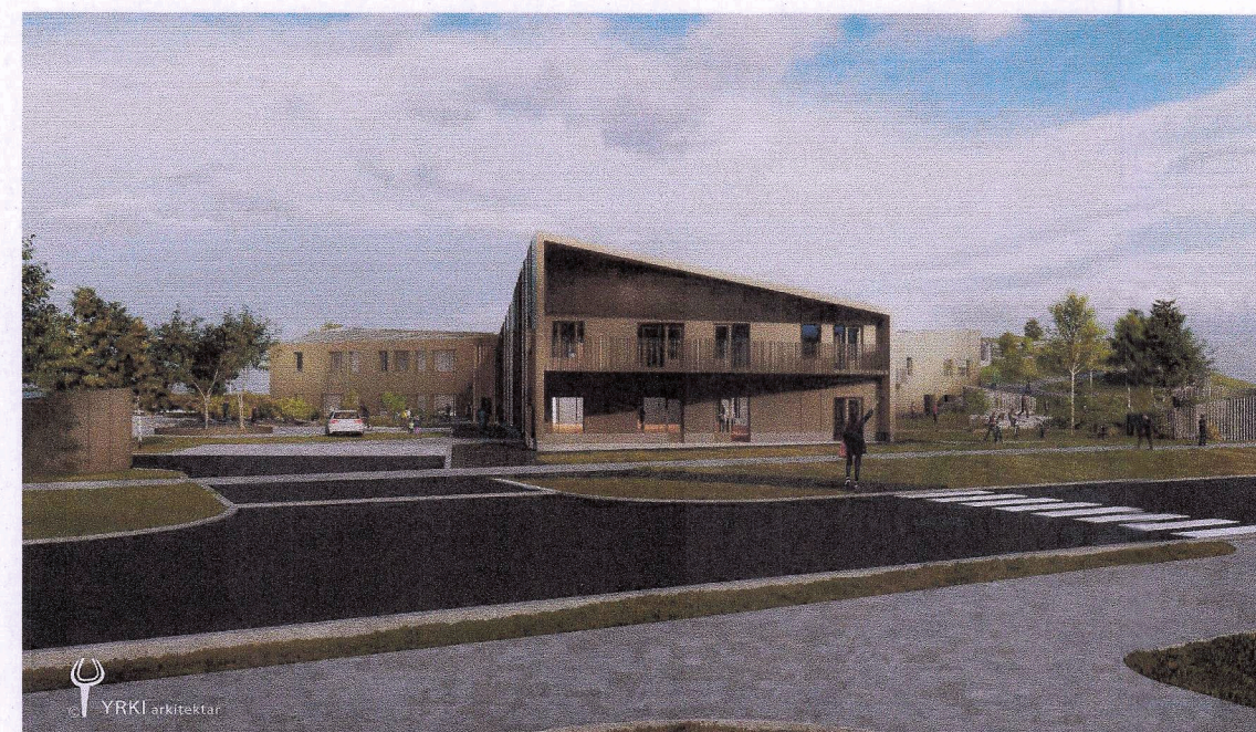
Skýringarmynd B - Horft að Fristundamiðstöð frá Langholti

F. Skipulagsfulltrúi Sveitarfélagið Árborg Rinnur Haldrup