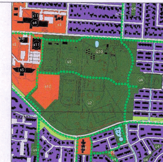
Hluti úr Aðalskipulagi Árborgar 2010 2030, ekki í kvarta