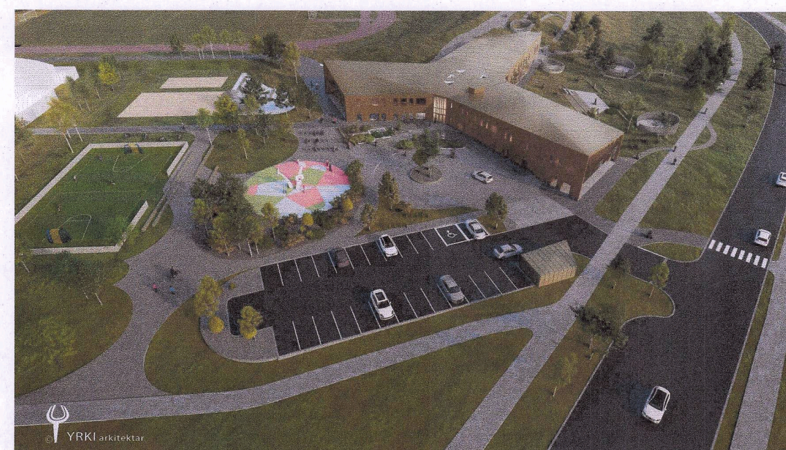
Skýringarmynd A - Horft yfir Fristundamiðstöð frá vestri