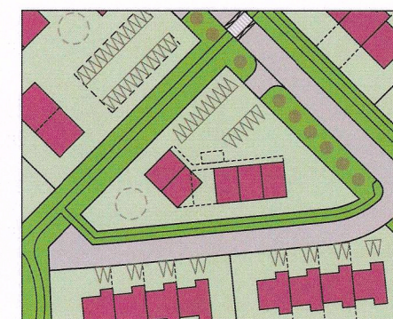
Skýringarmynd Mkv. 1:2000