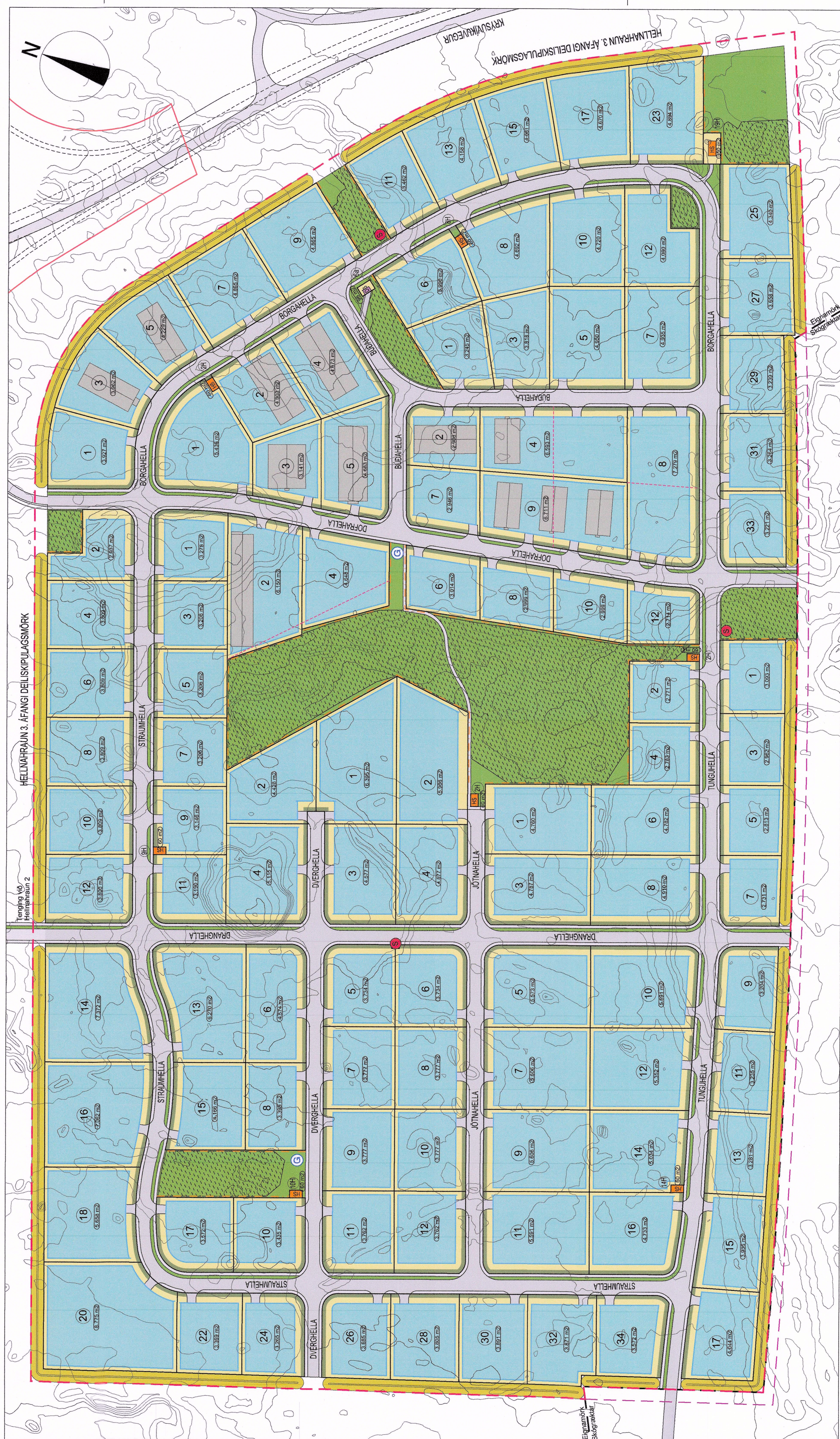
Eftir breytingu, mkv. 1:2000