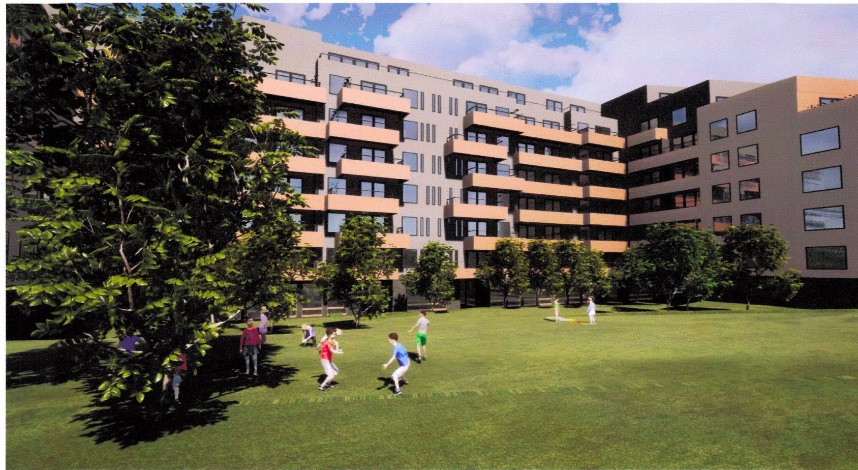
Þrívíddarmynd úr garði