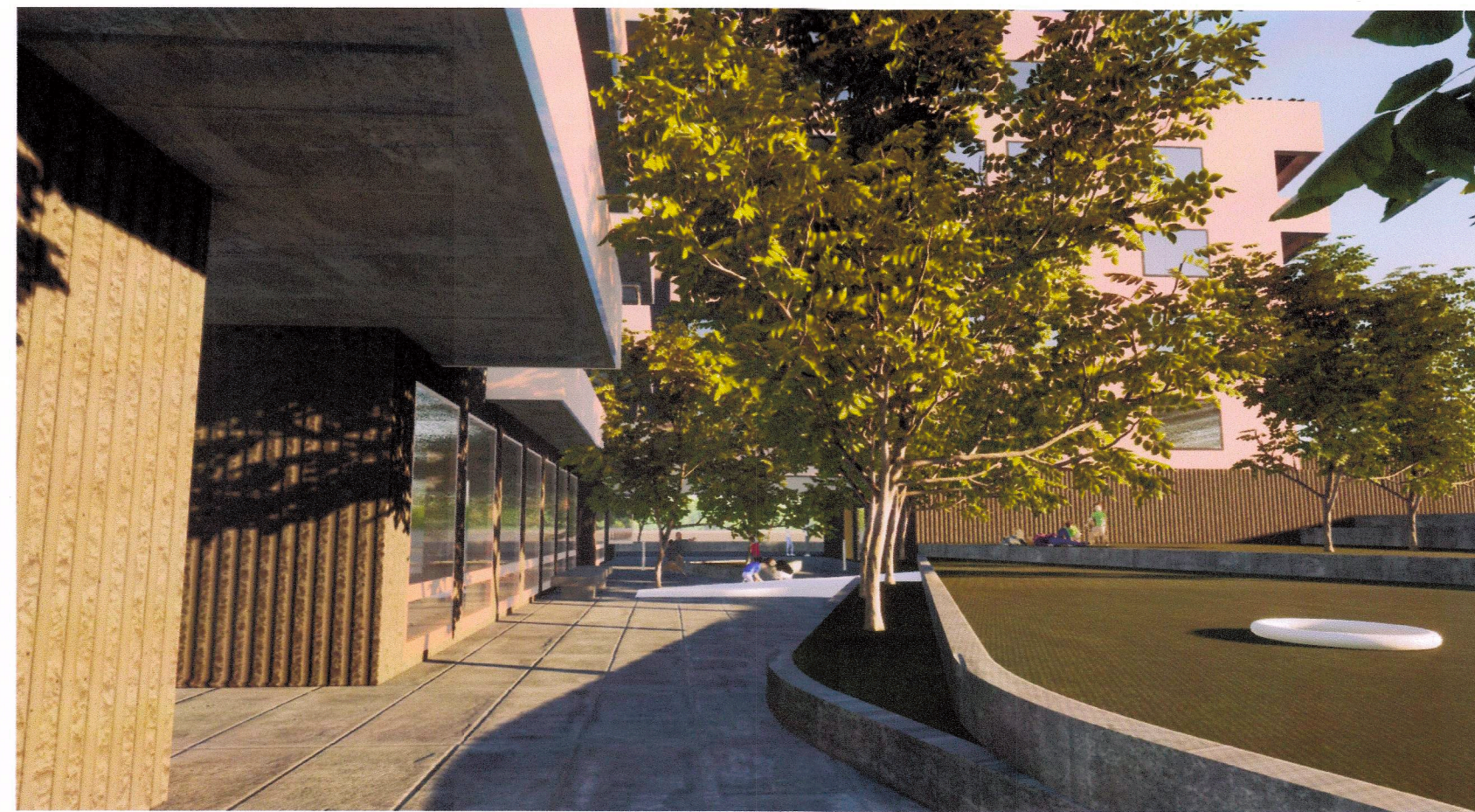
Þrívíddarmynd undir svölum horft inn í garð, horft í austur