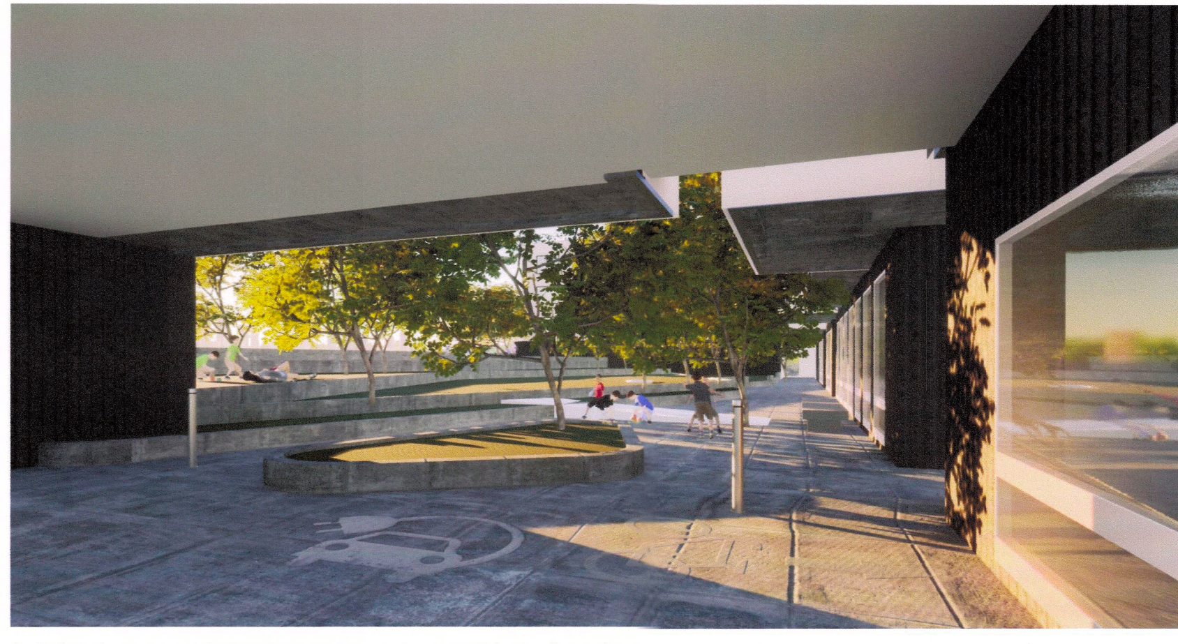
Þrívíddarmynd, jarðhæð opin að hluta inn í garð