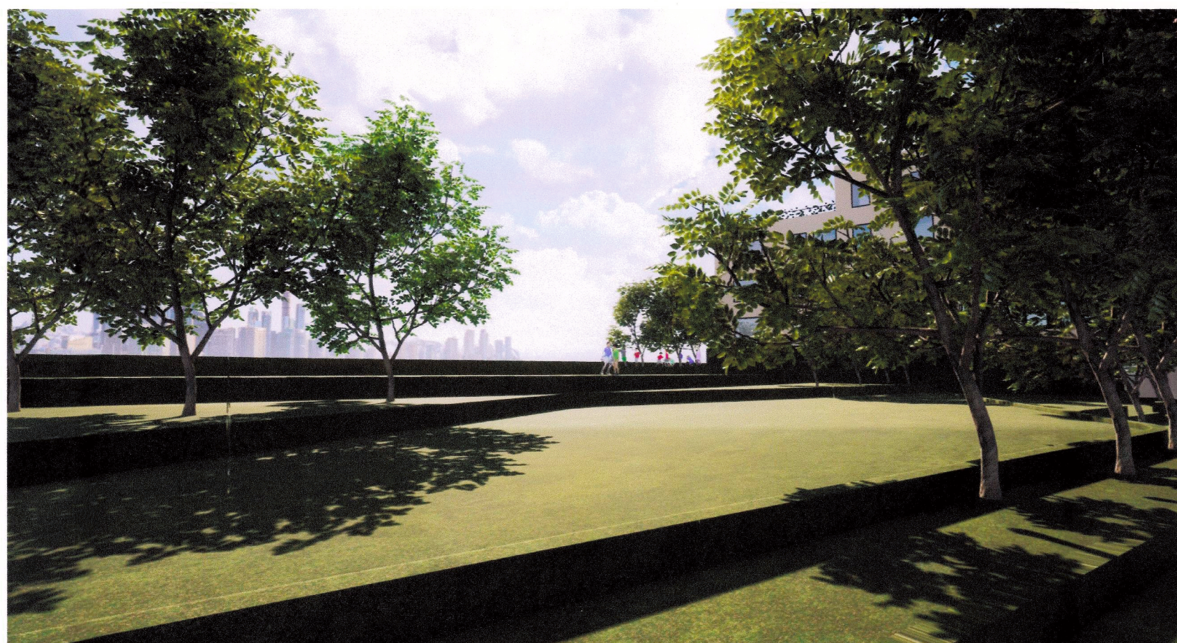
Þrívíddarmynd horft úr garði (byggingu austan við vantar)