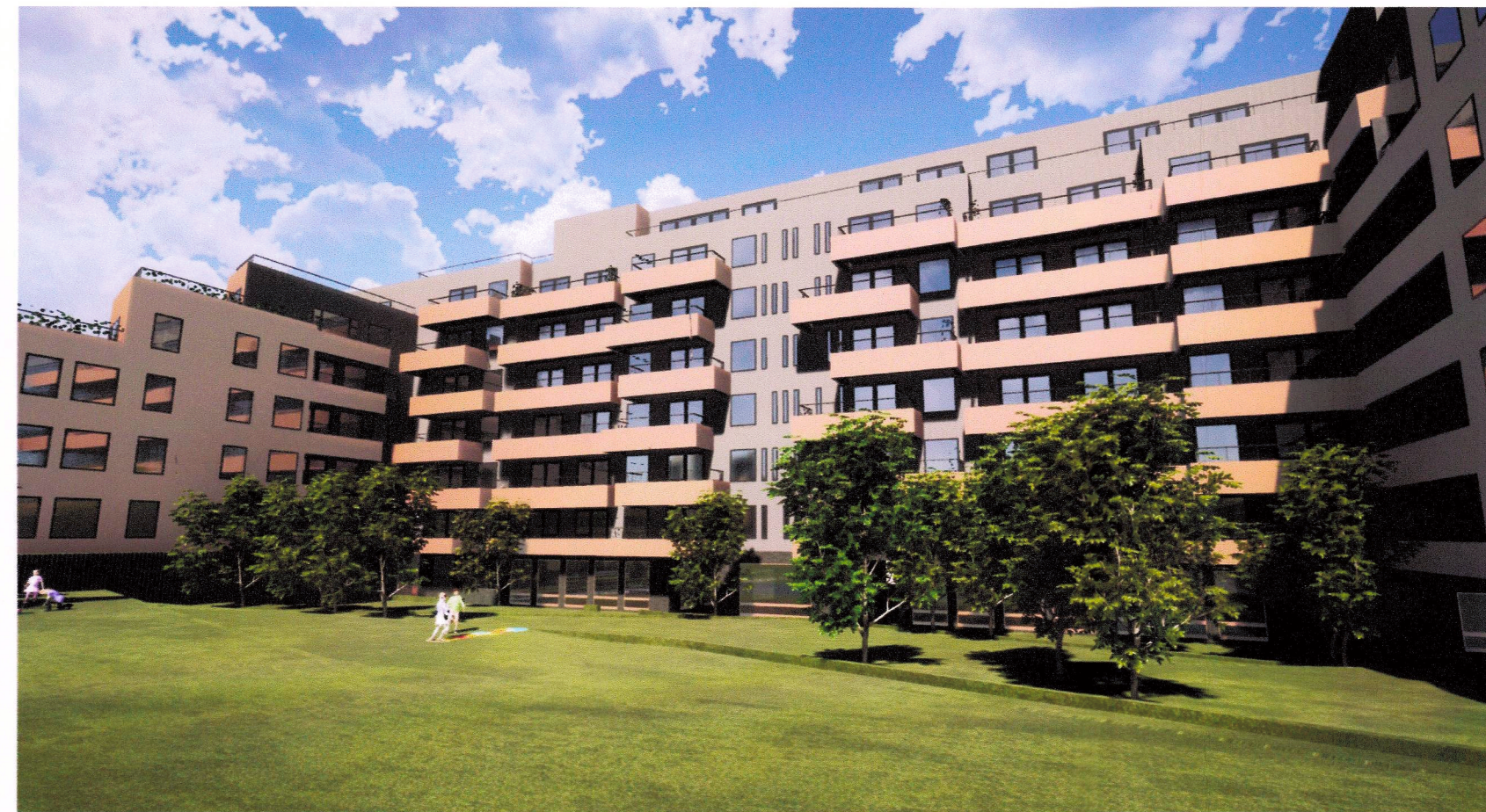
Þrívíddarmynd úr garði