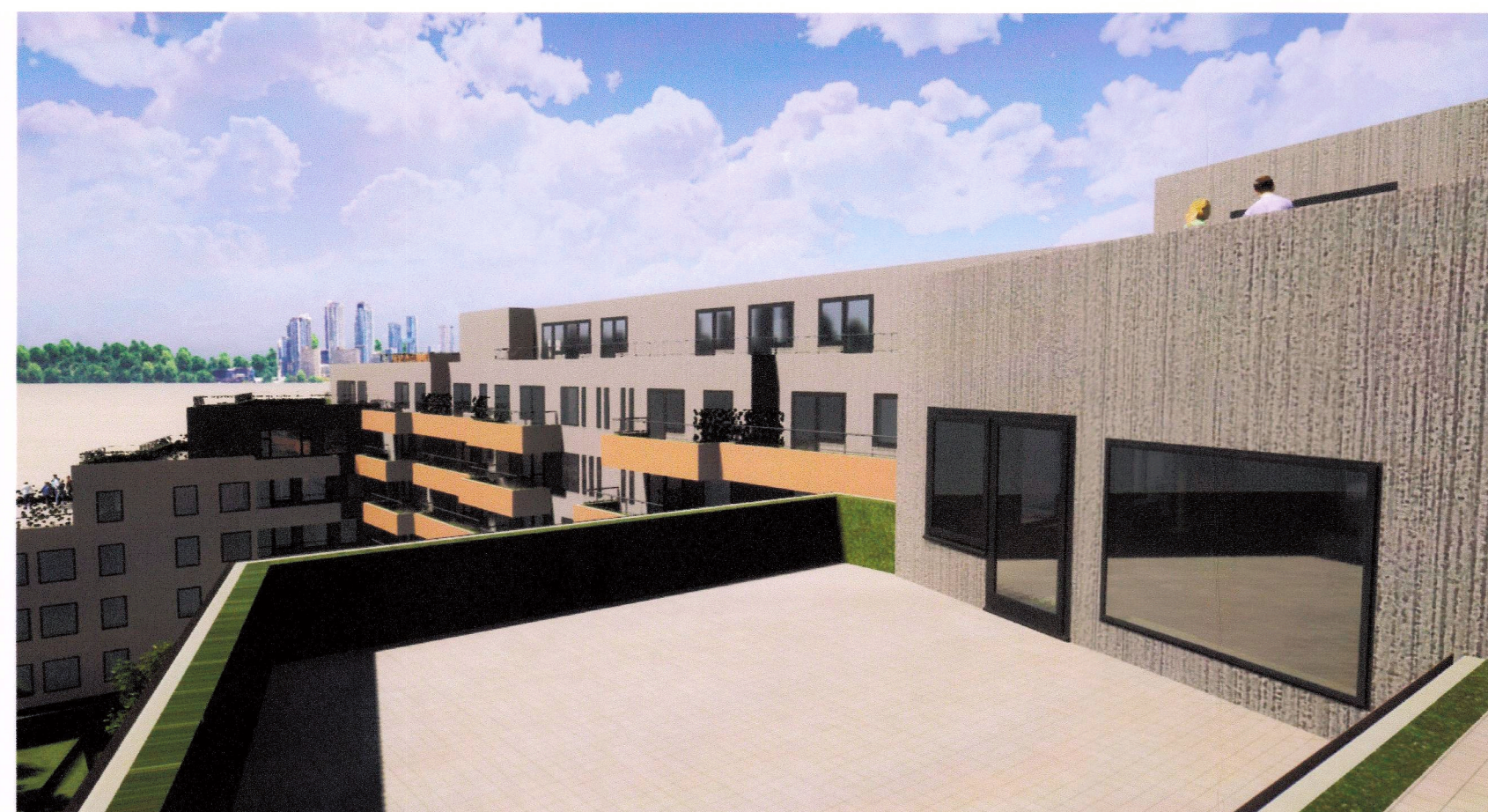
Þrívíddarmynd á þaksvölum