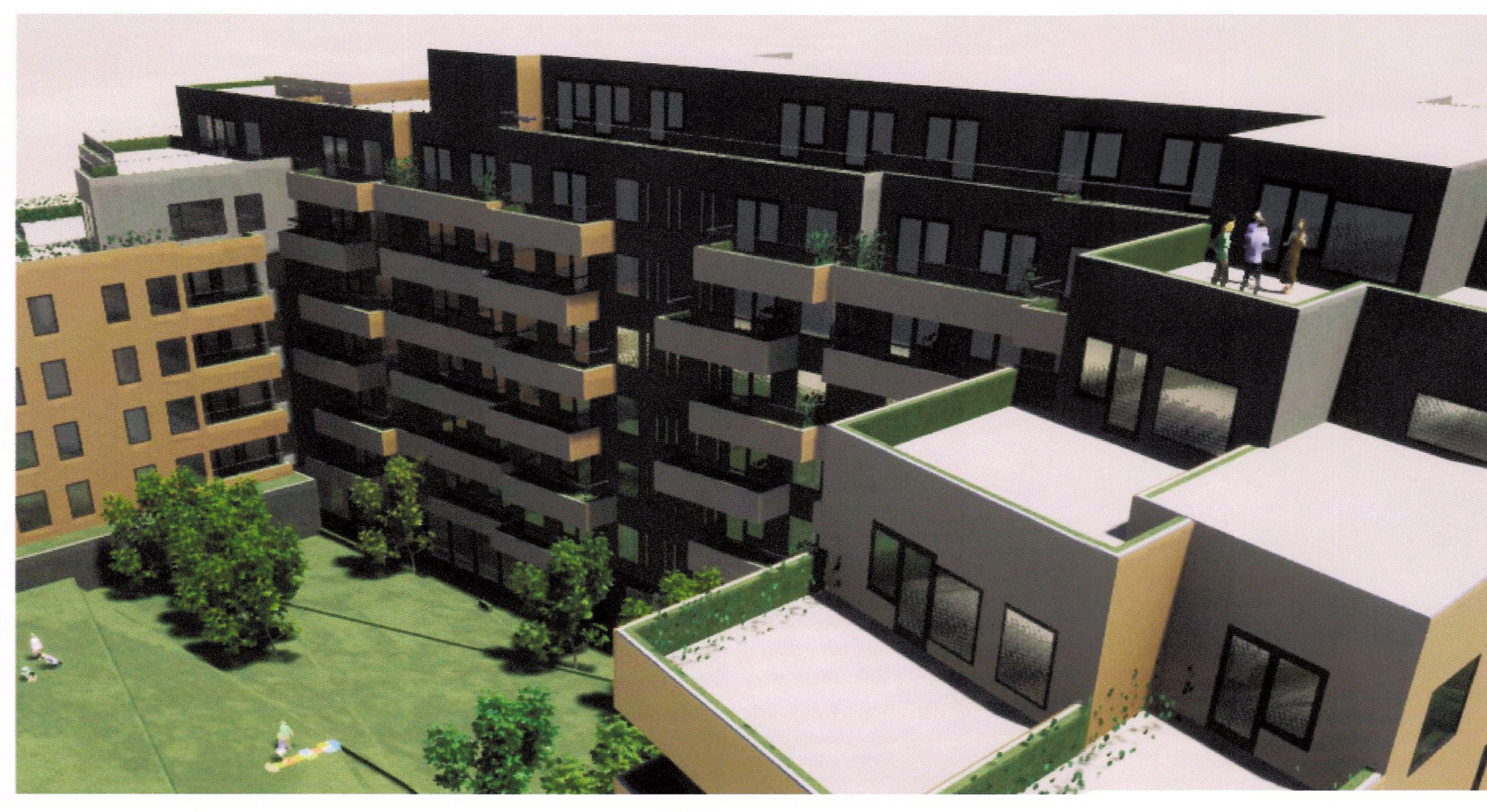
Þrívíddarmynd, horft yfir hús og garð til norð-vesturs