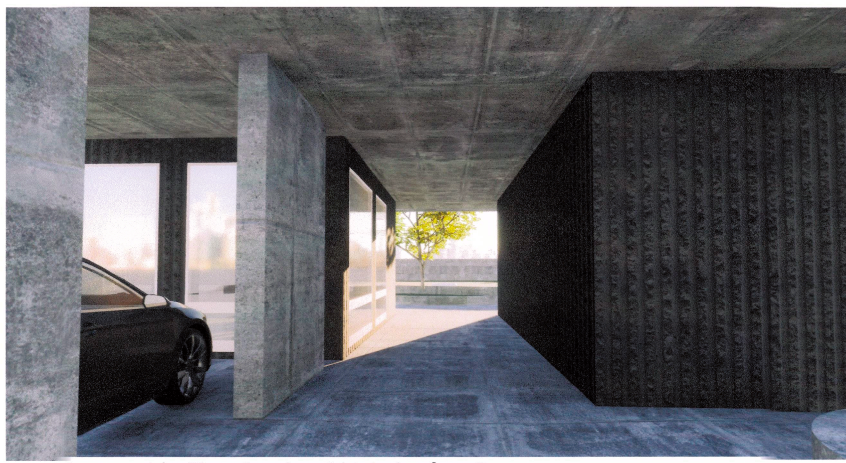
Þrívíddarmynd, jarðhæð opin að hluta inn í garð