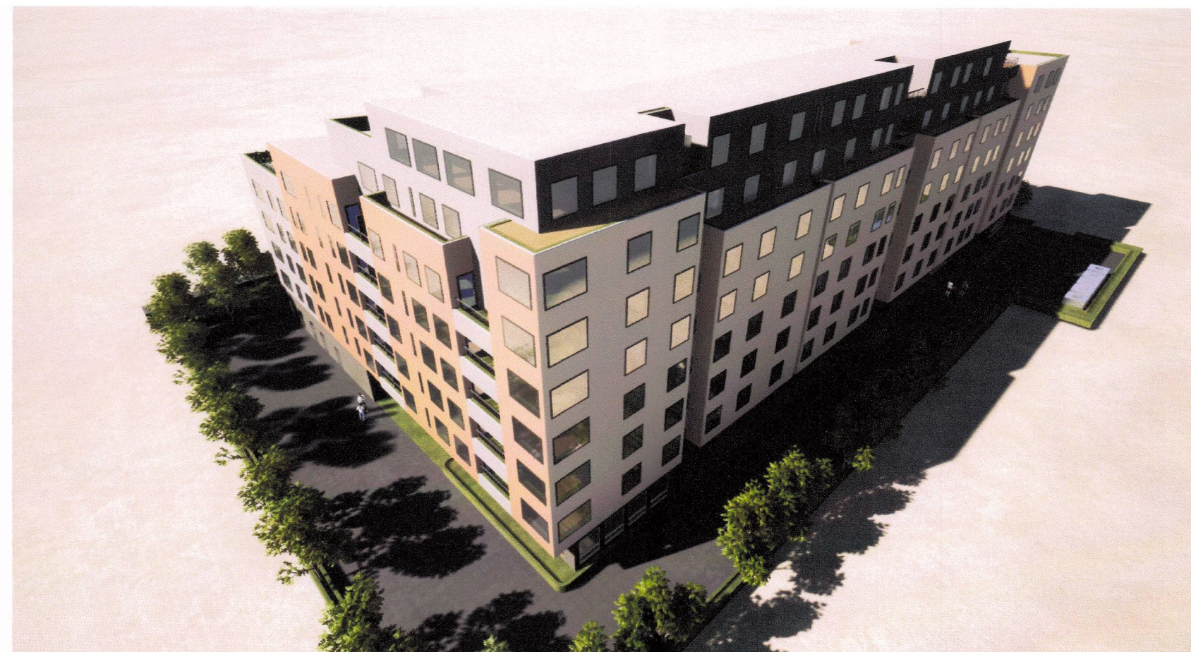
Þrívíddarmynd úr norð-austri