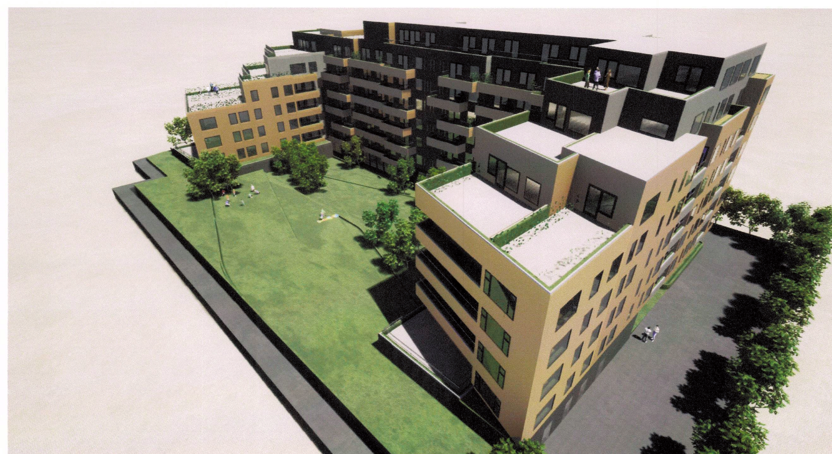
Þrívíddarmynd úr suð-austri