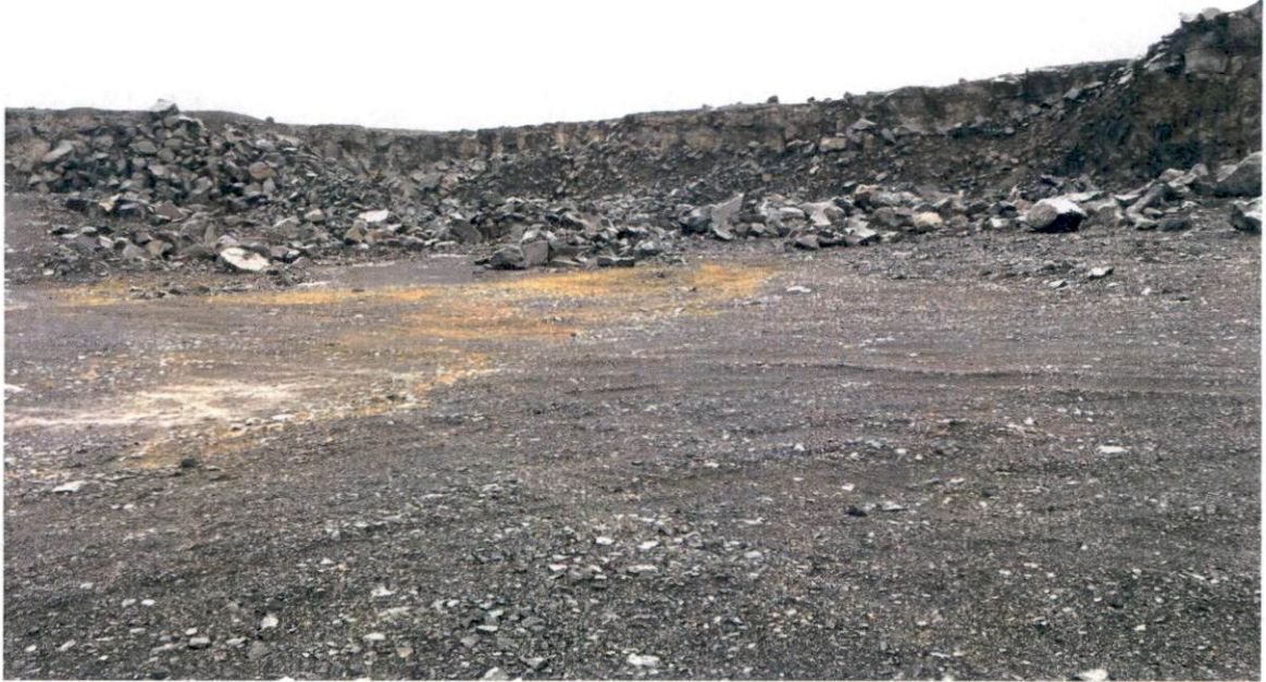
Mynd frá efnistökusvæðinu.