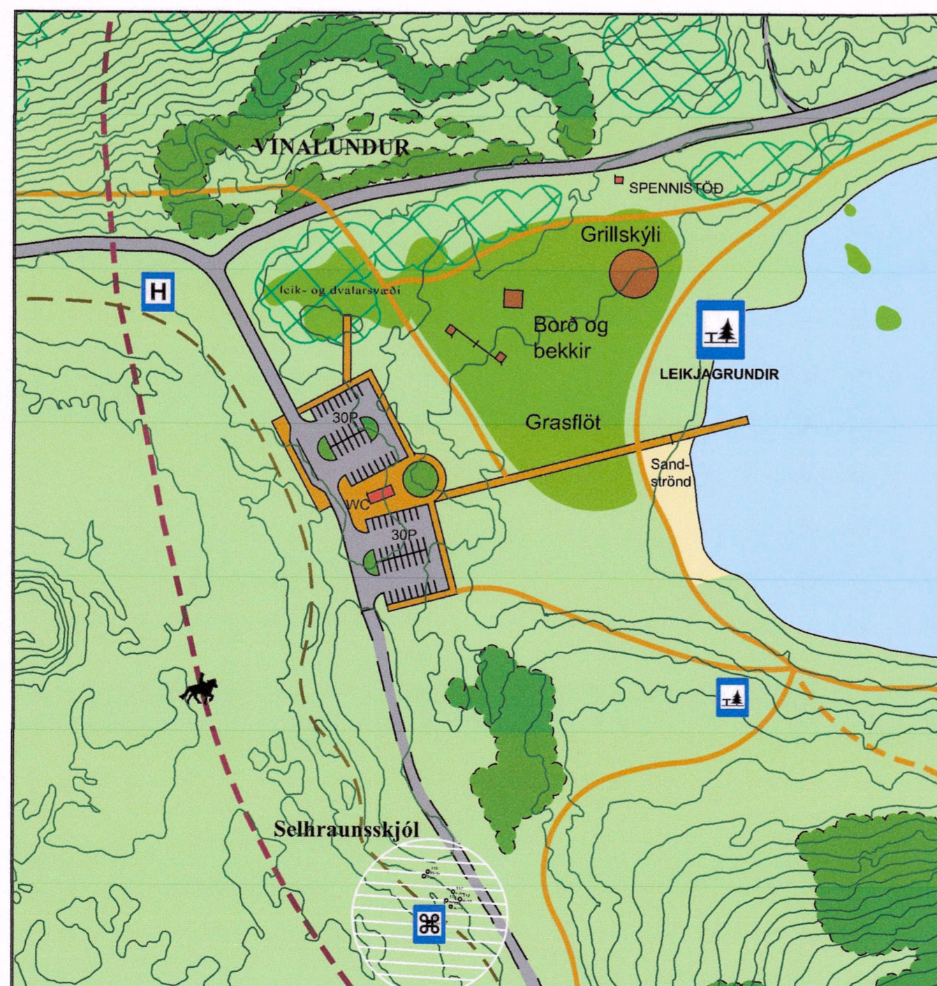
BREYTT DEILISKIPULAG REITUR 3 - ÞJÓNUSTUHÚS OG LEIKJAGRUNDIR VIÐ VESTURENDA HVALEYRARVATNS