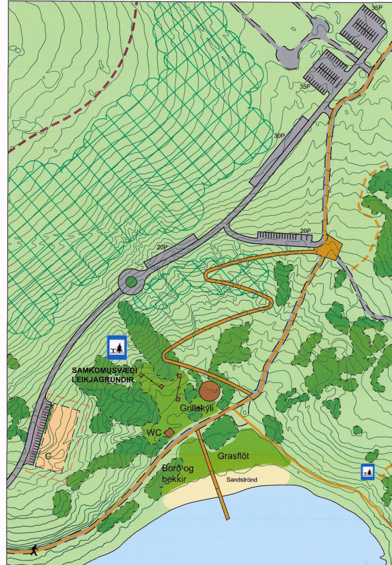
BREYTT DEILISKIPULAG REITUR 2 - ÁNINGARSTADUR OG LEIKJAGRUNDIR VIÐ NORDANVERT HVALEYRARVATN