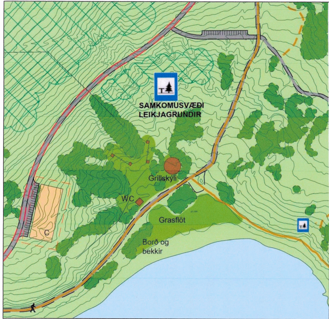
GILDANDI DEILISKIPULAG REITUR 2 - ÁNINGARSTADUR OG LEIKJAGRUNDIR VIÐ NORDANVERT HVALEYRARVATN