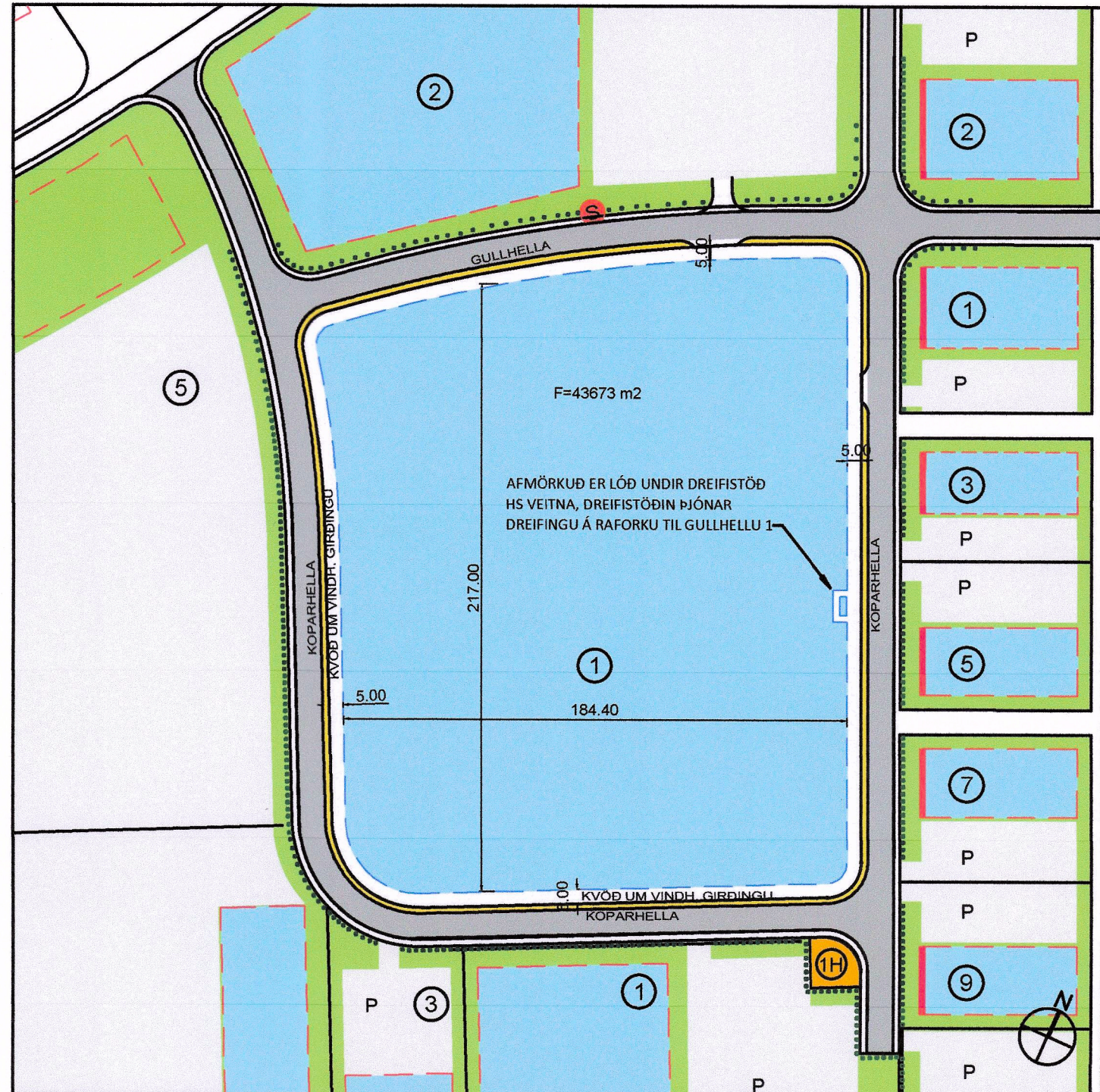
FYRIR BREYTINGU - Í GILDI FRÁ 05.04.2023 MEÐ SÍÐARI BREYTINGUM MKV 1:2000