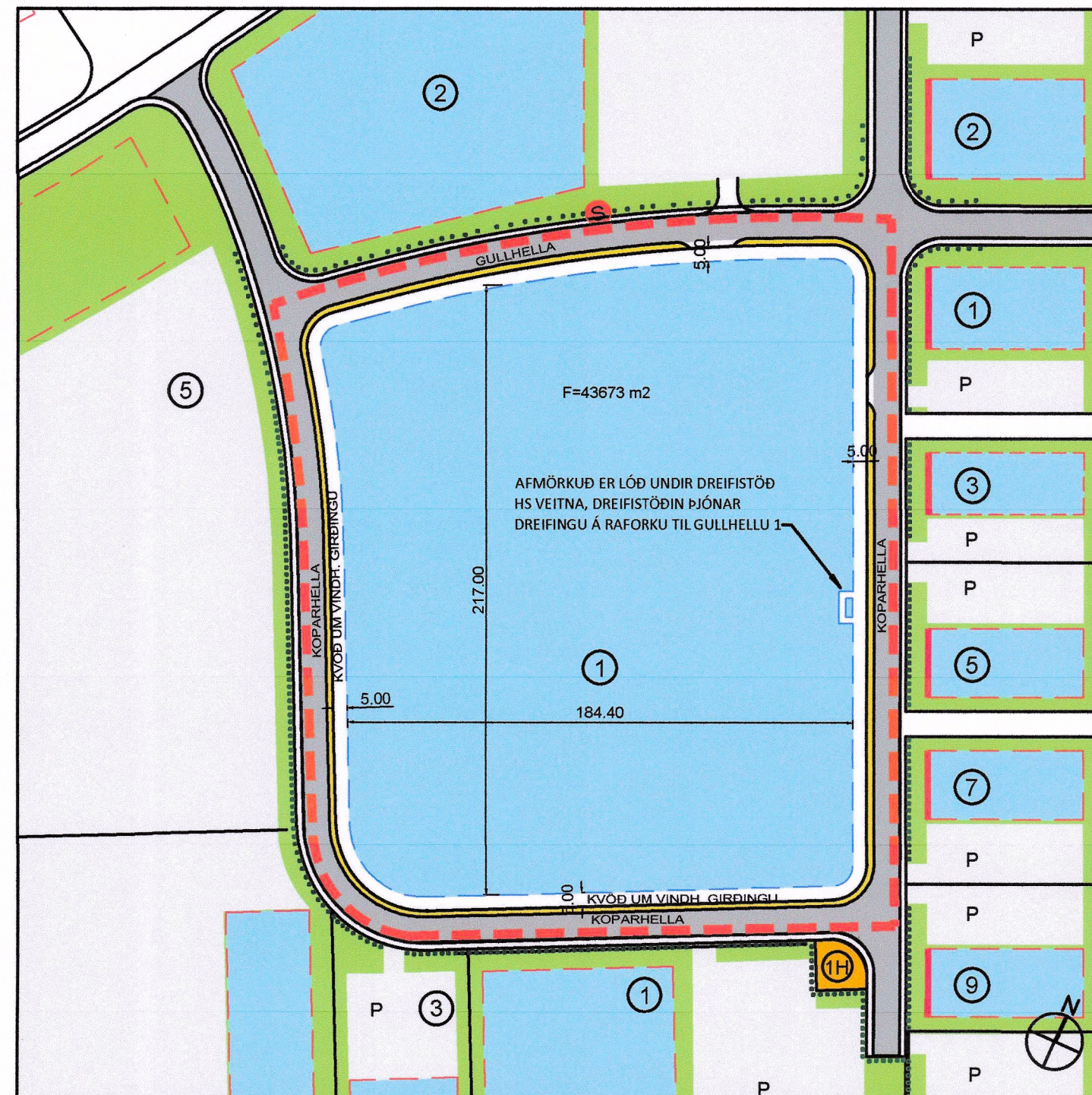
EFTIR BREYTINGU MKV 1:2000