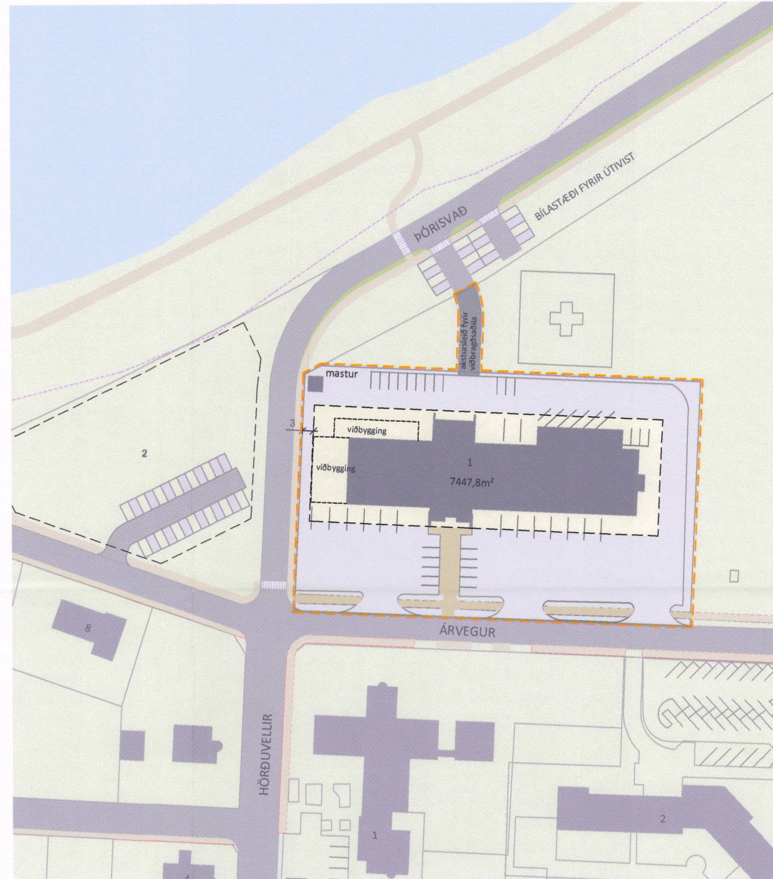
BREYTTUR DEILISKIPULAGSUPPDRÁTTUR 1:1000