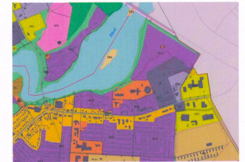
HLUTI AÐALSKIPULAGS ÁRBORGAR ÞÉTTBÝLI 2020-2036