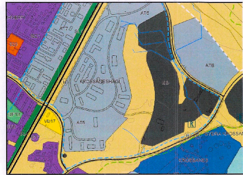
Aðalskipulag Akureyrar 2018 - 2030 - mkv. 1:10.000