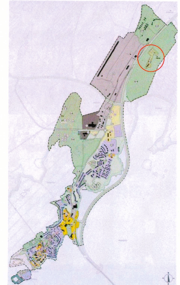
Aðalskipulag Borgarbyggðar - þéttbýlisuppráttur Borgarness

Aðalskipulagsbreyting var staðfest með auglýsingu í B-deild Stjórnartíðinda þann _____