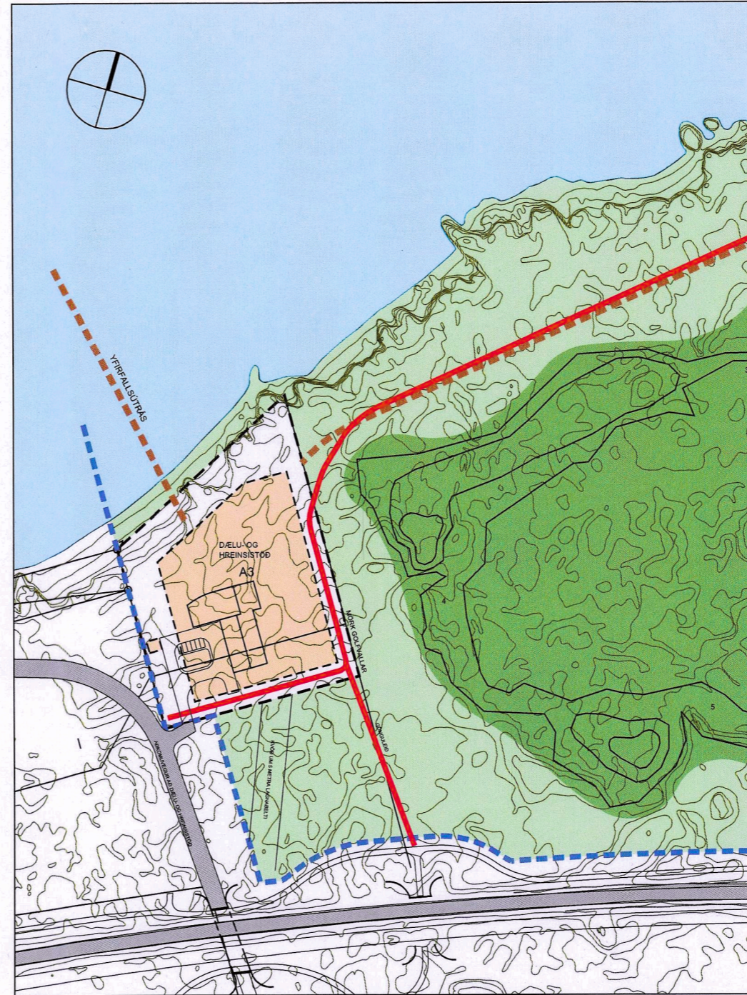
BREYTT DEILISKIPULAG 1.3000