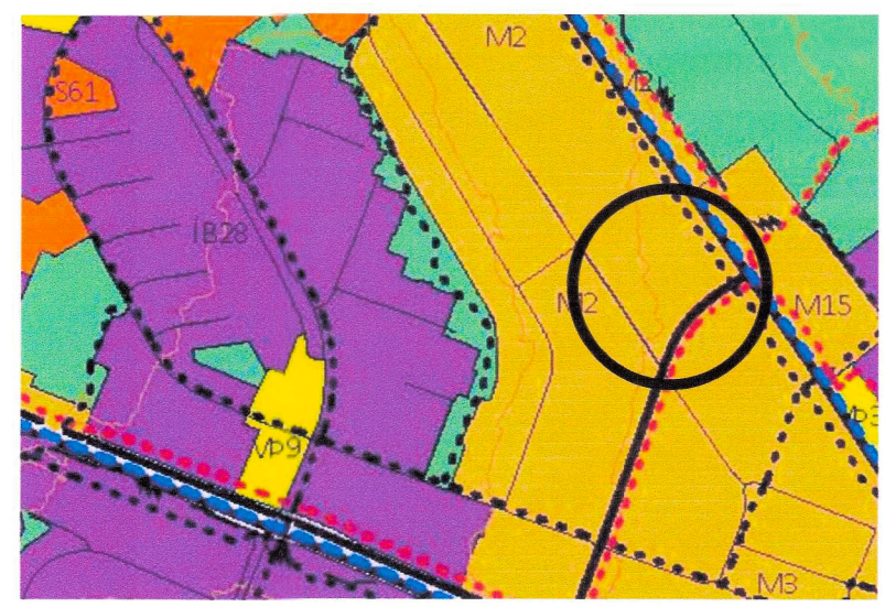
Aðalskipulag Reykjavíkur 2040