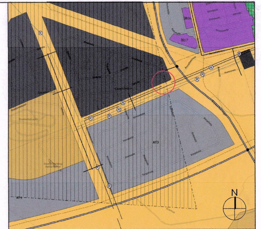
YFIRLIT - HLUÐI ADALSKIPULAGS HAFNARFJARÐAR 2013 - 2025