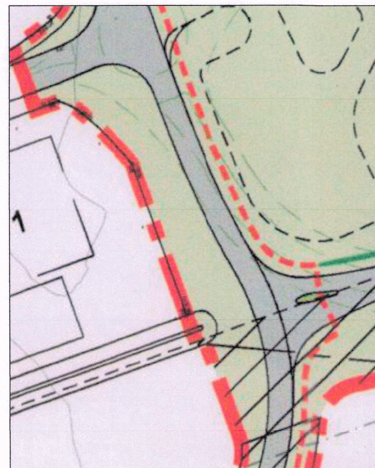
Hellnahraun 2. Áfangi, hringtorg við Krýsuvíkurveg í gildi frá 08.04.2015, MKV 1:1000

Auglýsing um gildistöku deiliskipulagsins var birt í B-deild Stjórnartíðinda þann 26.01. 2024