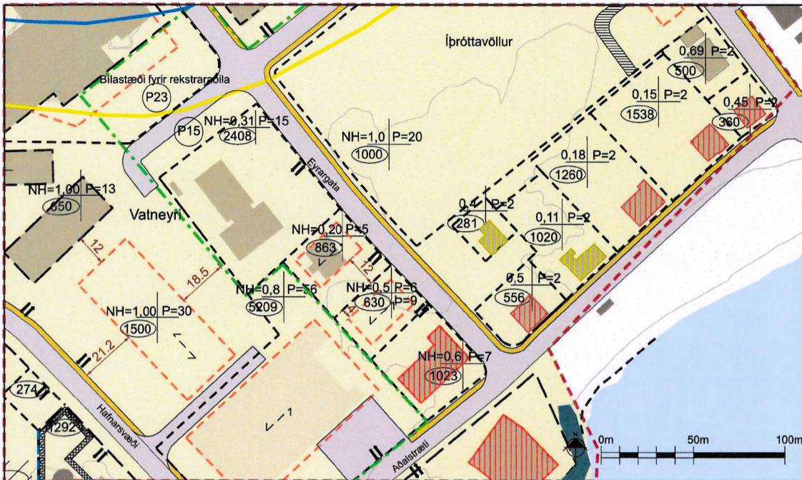
Gildandi deiliskipulag frá júní 2013, m.s.br. mkv. 1:2000.