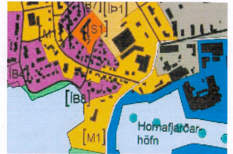
Aðalskipulag Sveitarfélagsins Hornafjörður ekki í kvarða

Aðalskipulagsbreyting þessi kallar ekki á breytingu gildandi deiliskipulags, þar sem breytingin rúmast innan deiliskipulagsins. Því er aðeins um að ræða breytingu í texta á gildandi aðalskipulagi.