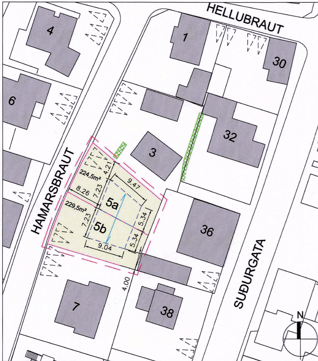
Fyrir breytingu deiliskipulagið öðlaðist gildi 13.04.2018

Laugaveg 26 101 Reykjavík tlf: 450400-3510 sími: 530 6990 fax: 530 6991 vaarkitektar@vaarkitektar.is www.vaarkitektar.is