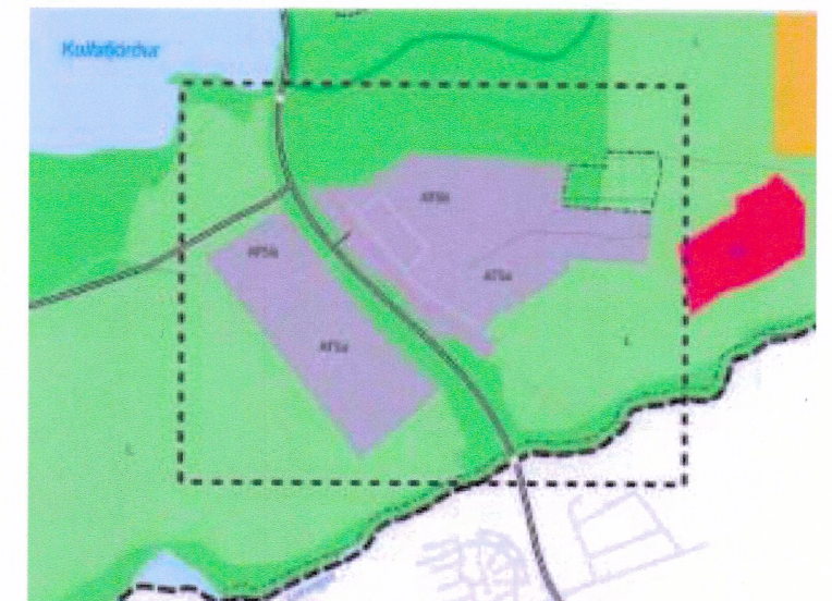
Aðalskipulag Reykjavíkur 2010-2030

Að öðru leyti gilda núgildandi skilmálar.