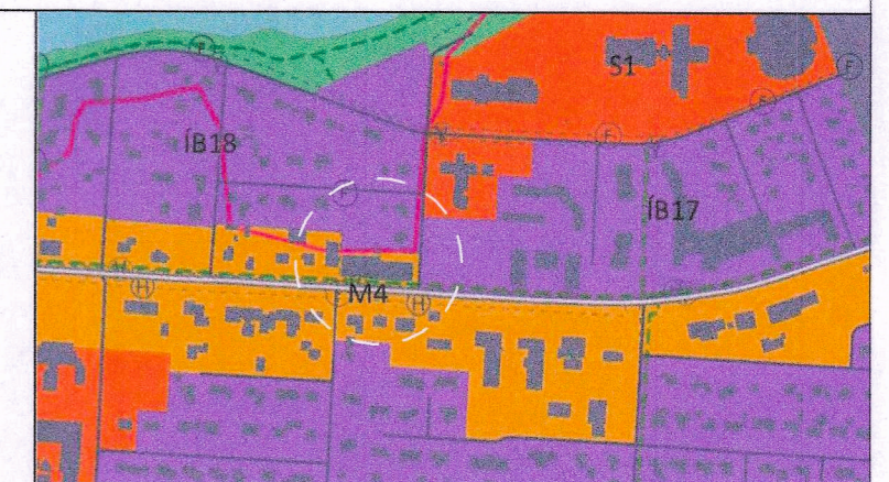
Hluti aðalskipulags Árborgar 2020-2036