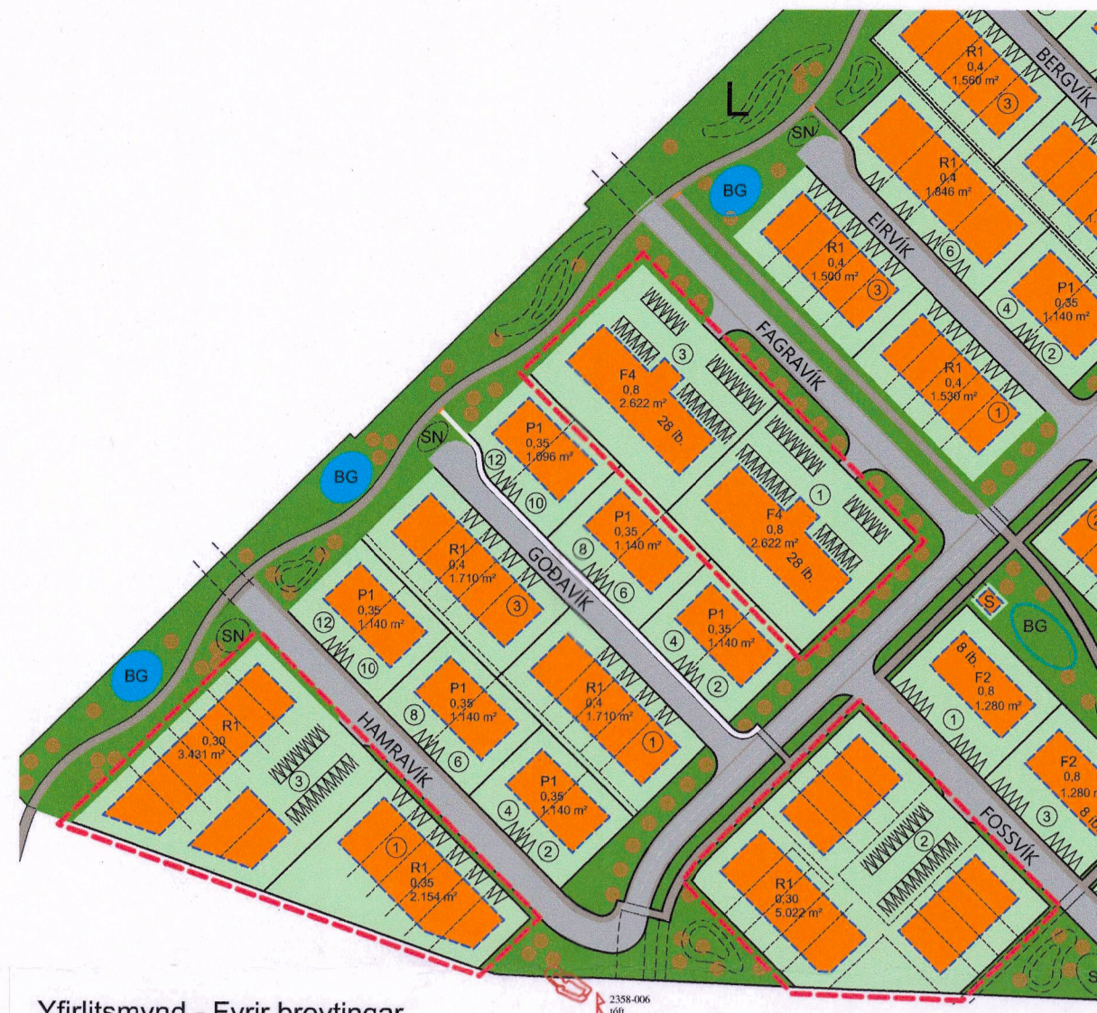
Yfirlitsmynd - Fyrir breytingar