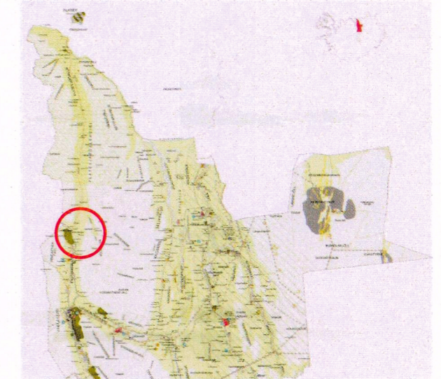
AÐALSKIPULAG ÞINGEYJARSVEITAR 2010-2022

Svæðið sem breytingin nær til er innan rauða hringsins