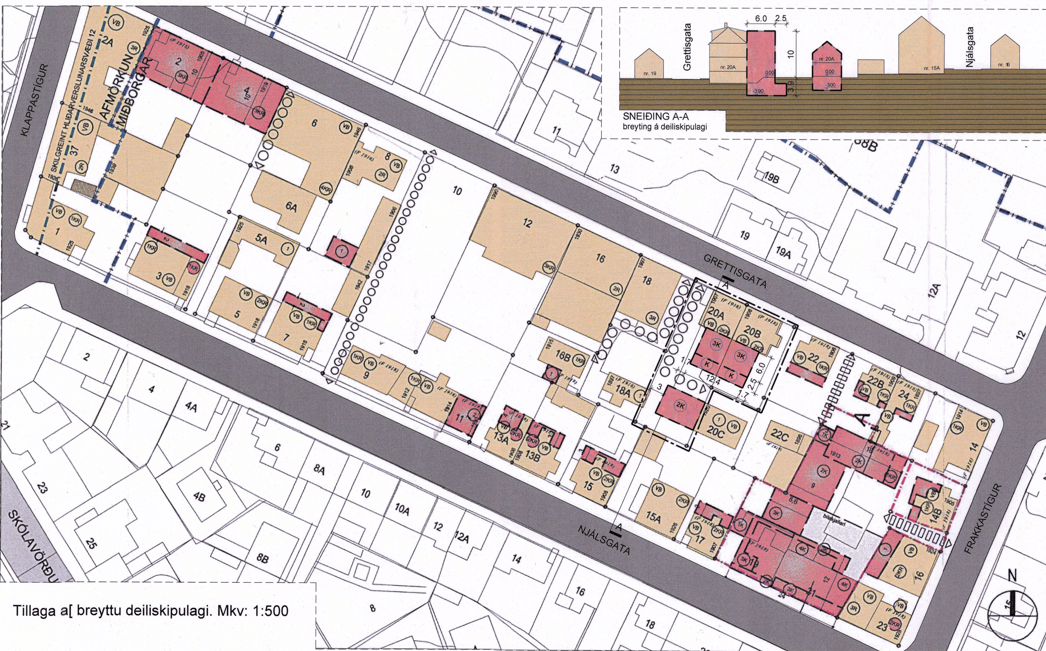
Tillaga a[ breyttu deiliskipulagi. Mkv: 1:500